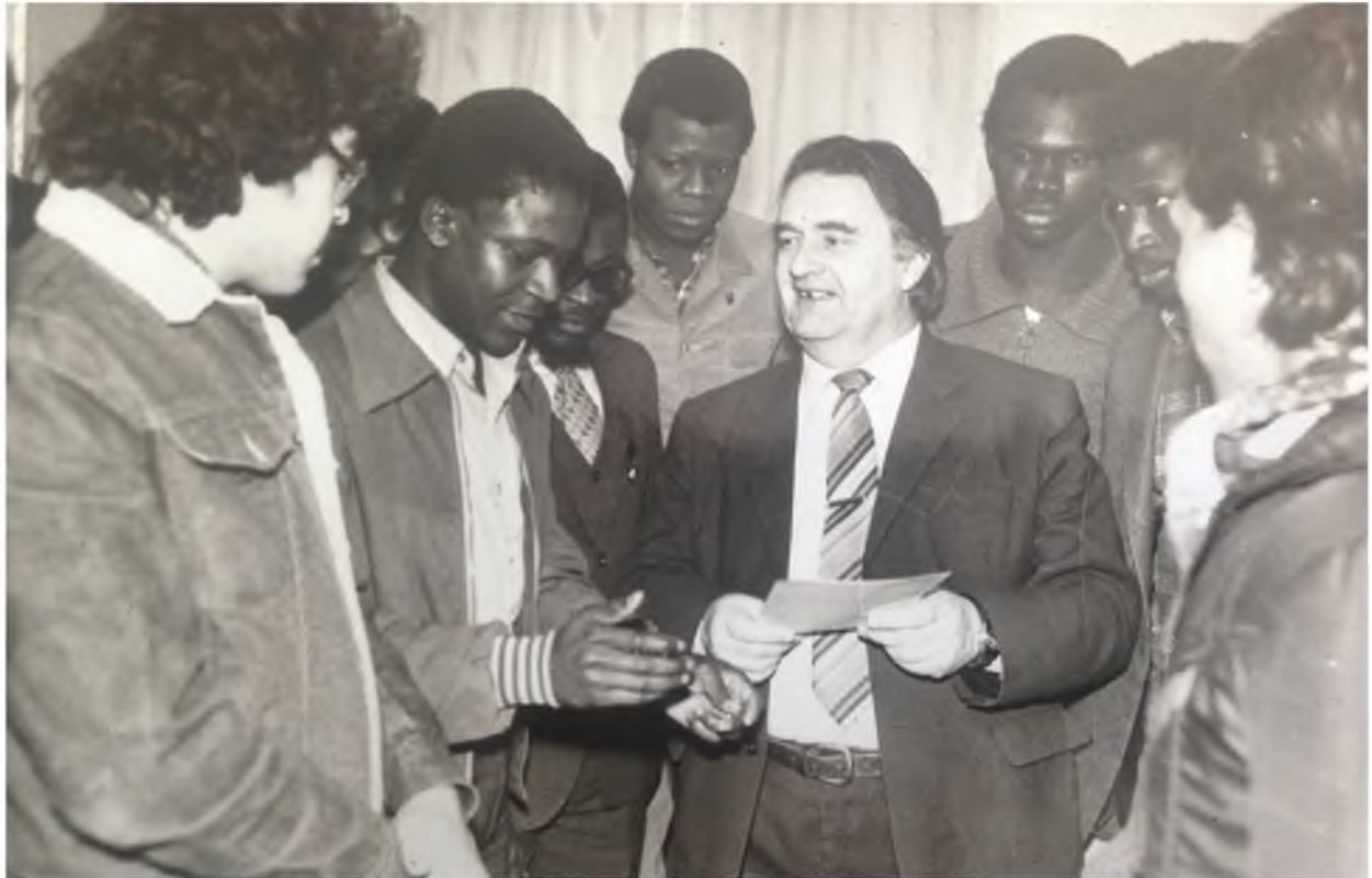
Иностранные студенты на избирательном участке (1984 г.)