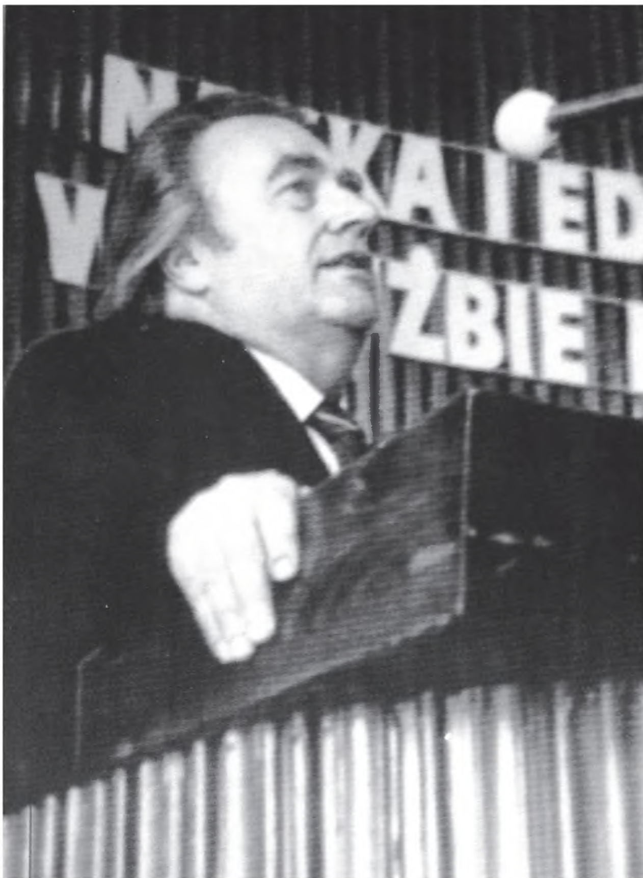
Выступление в Опольской высшей педагогической школе 1 октября 1987 года