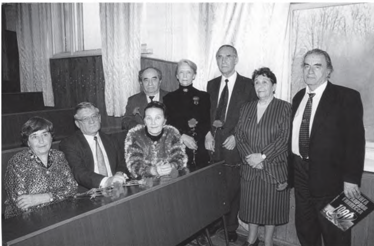
Ветераны кафедры педагогики (2000 г.)