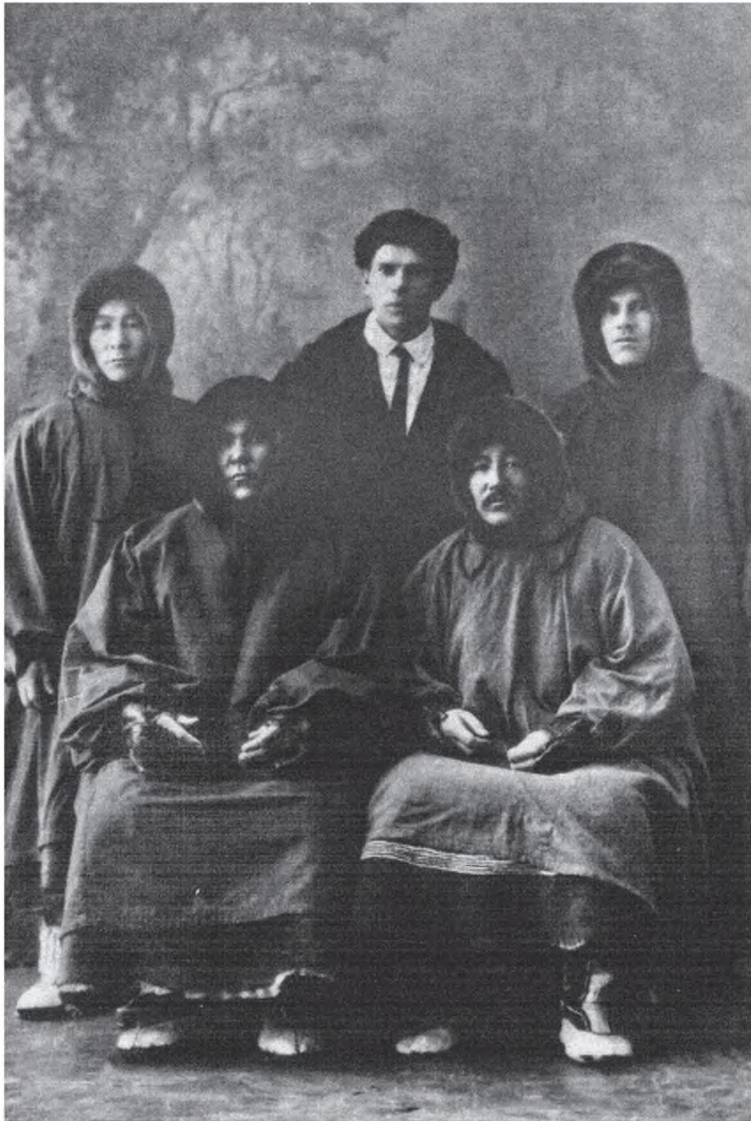
Отец – директор Северного краевого музея с обитателями Ненецкой Тундры (г. Архангельск, 1932 г.)