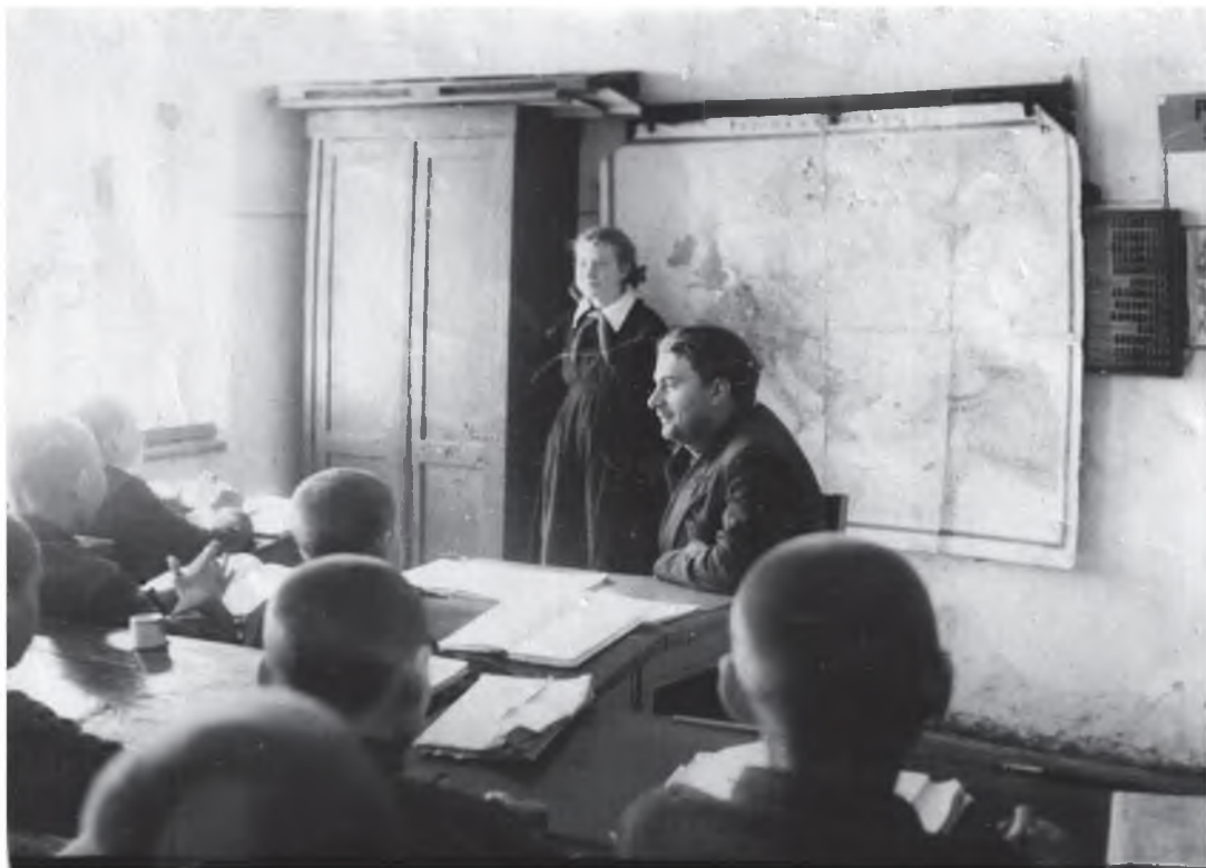
Веду урок в Солнце – Дубравской школе (1957 г.)