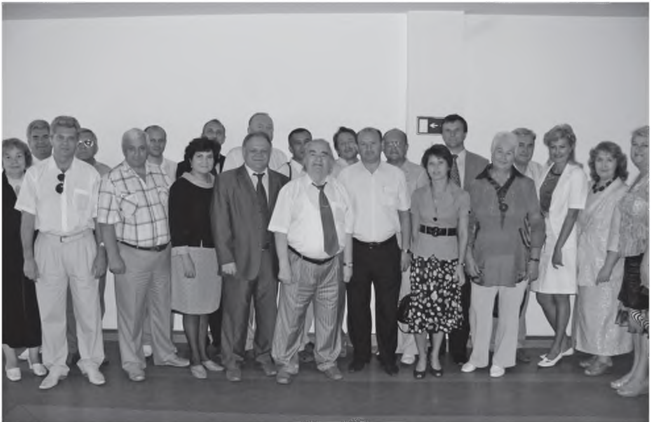
С деканами всех факультетов БелГУ (2008 г.)