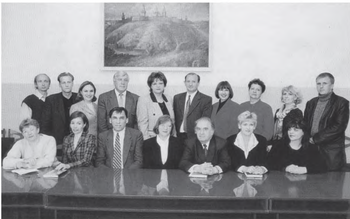
Объединенный профсоюзный комитет БелГУ (1998 г.)