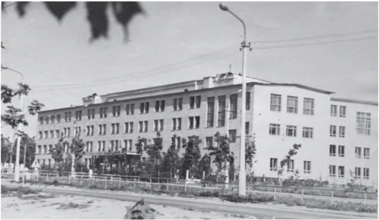
Так выглядел педагогический институт в 1968 году