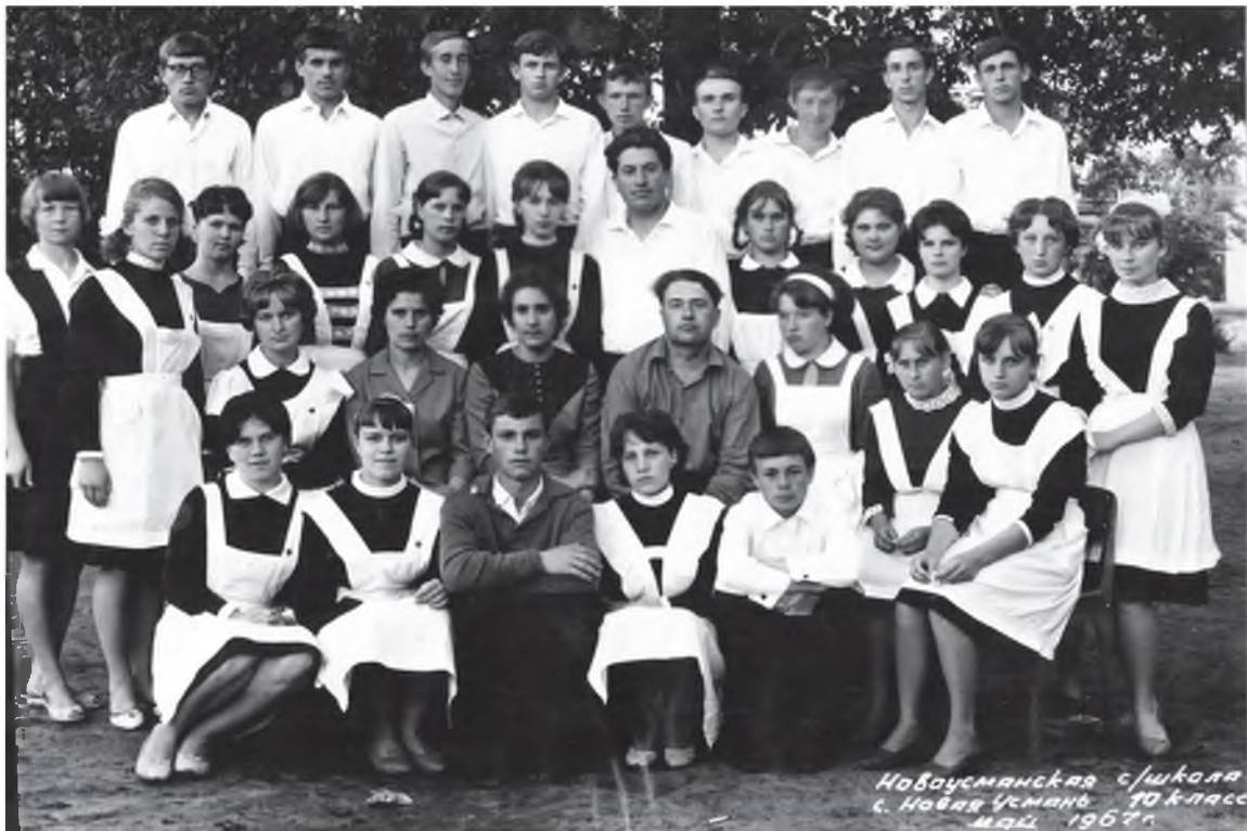
С выпускниками 10-А класса Новоусманской средней школы (1967 г.)