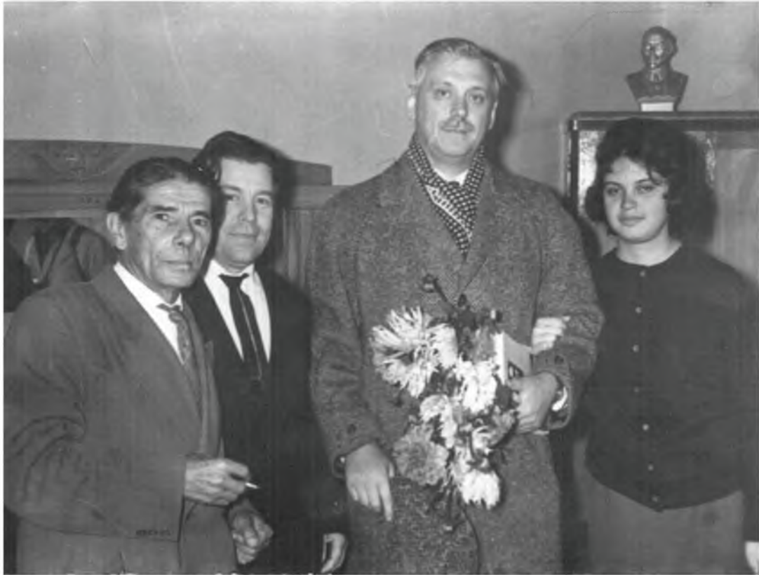
Встреча отца (крайний слева) с С.В. Михалковым в Воронеже (1960 г.)