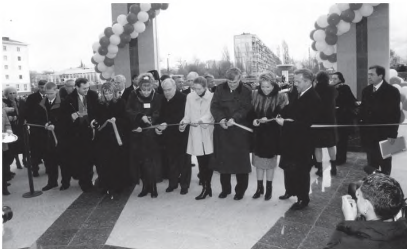
Открытие нового корпуса БелГУ (2 ноября 2001 г.)