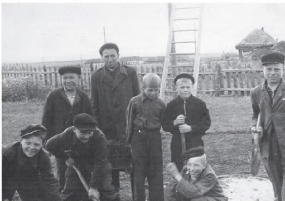
Ученики Солнце – Дубравской семилетки. Где они теперь, кто знает?