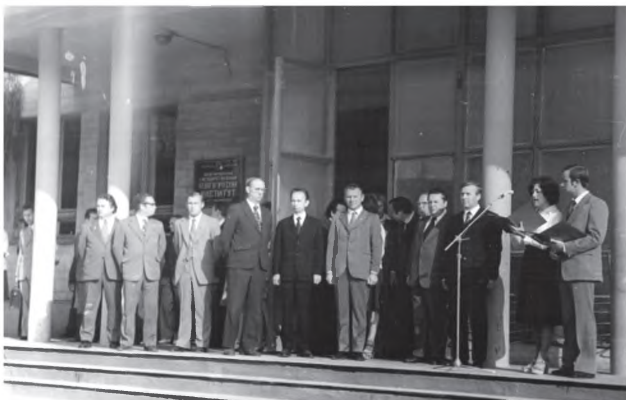
Начало учебного года 1 сентября 1976 года