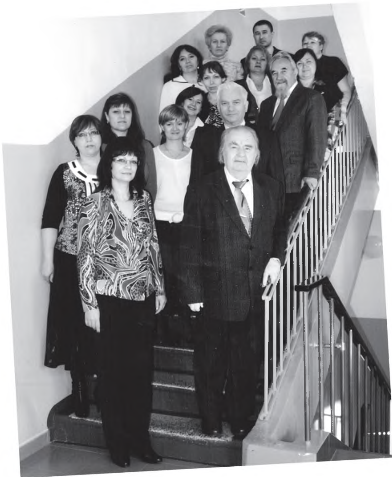
Кафедра педагогики НИУ «БелГУ» (2010 г.)