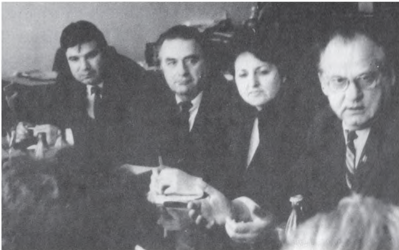
Встреча руководителей вуза с Министром просвещения РСФСР Г.П. Веселовым (1988 г.)