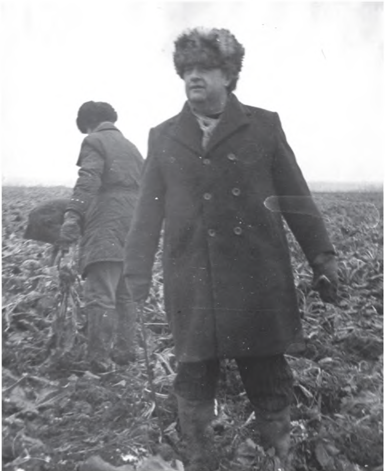
Убираем сахарную свеклу (9 ноября 1978 г.)