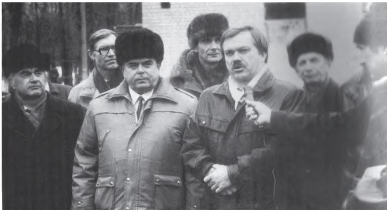
На митинге, посвященном закладке фундамента общежития выступает глава администрации Белгородской области Е.С. Савченко; слева - ректор БГПУ Н.В. Камышанченко. 14 февраля 1995 г.