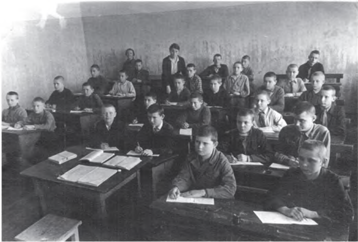
6 класс школы № 2 г. Воронежа. Я на последней парте в гордом одиночестве (1948 г.)