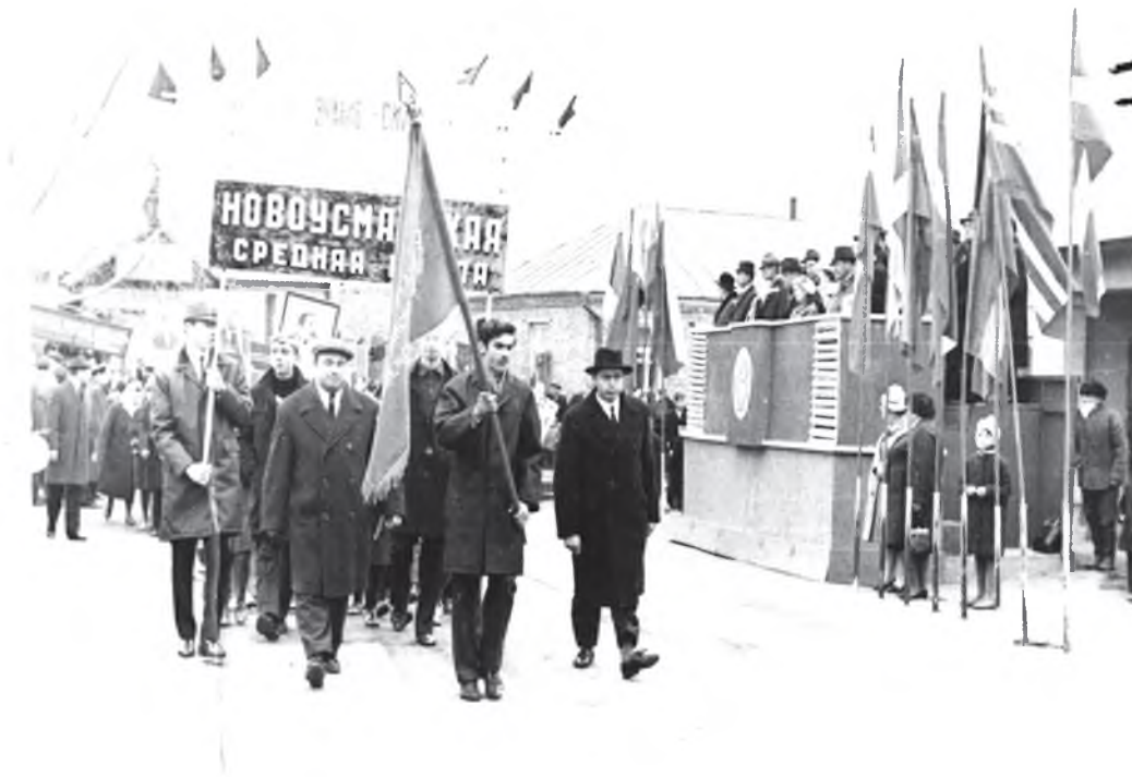
Первомайская демонстрация (1968 г.)