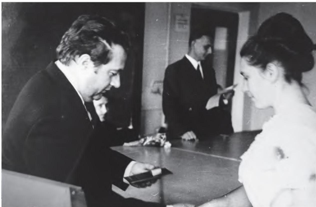
Вручение дипломов на заочном отделении физмата (1972 г.)