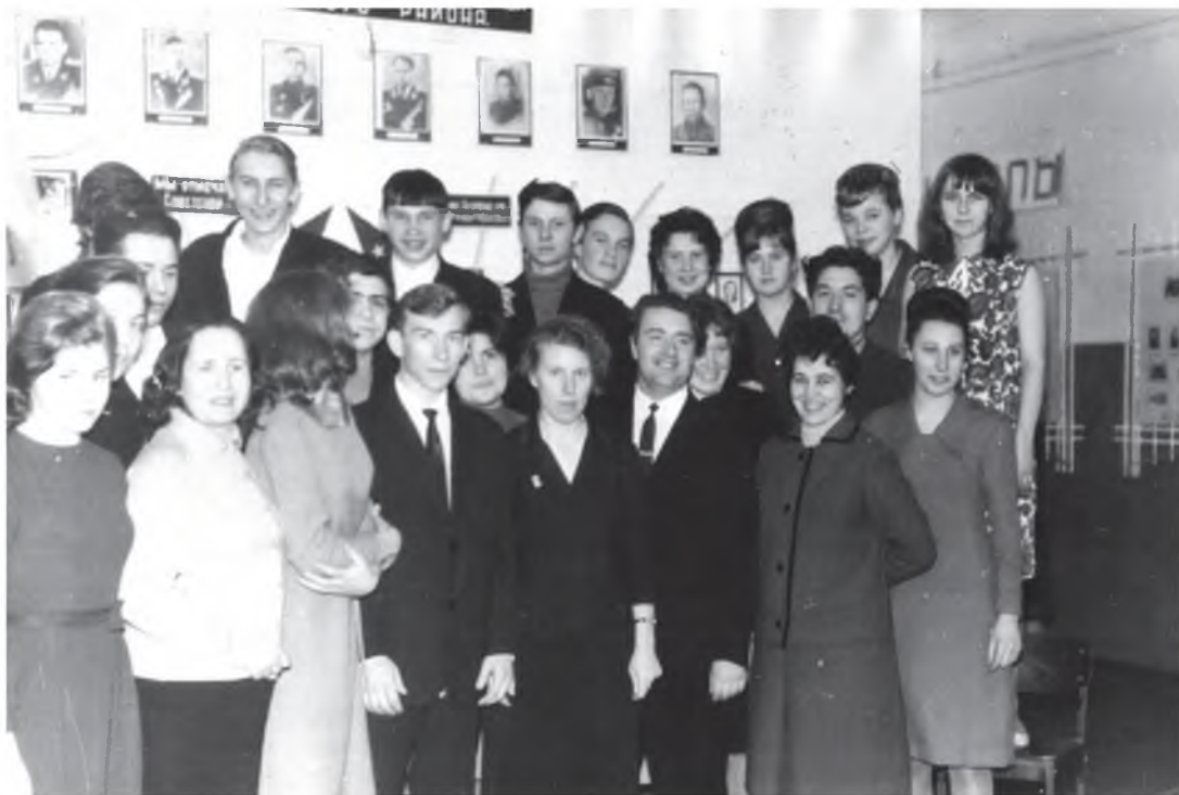
Среди коллег и учащихся Новоусманской средней школы (1967 г.)