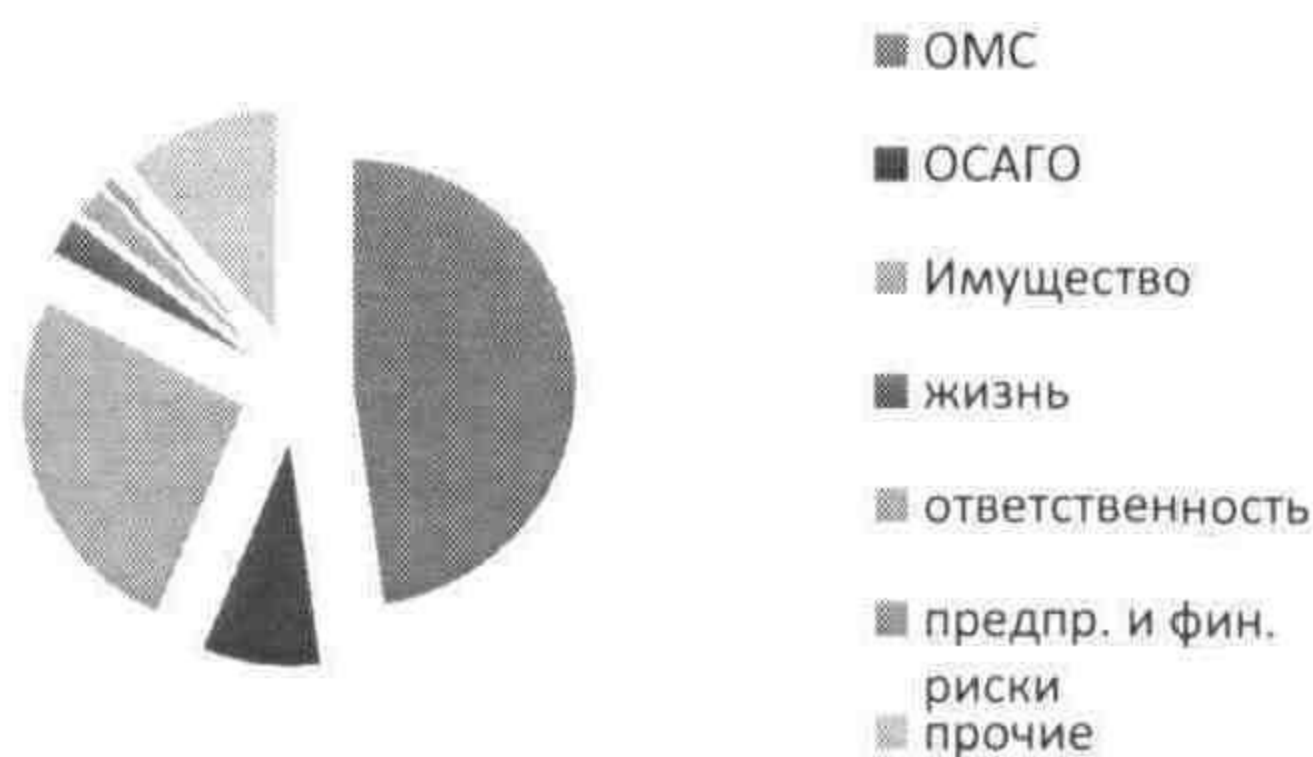
Рис. 2. Структура страхового портфеля

По итогам 2011 года объем страховых премий, собранных страховыми компаниями на региональном рынке Белгородской области составил 8066,80 млн. руб., что на 21,8% больше по сравнению с 2010 годом.