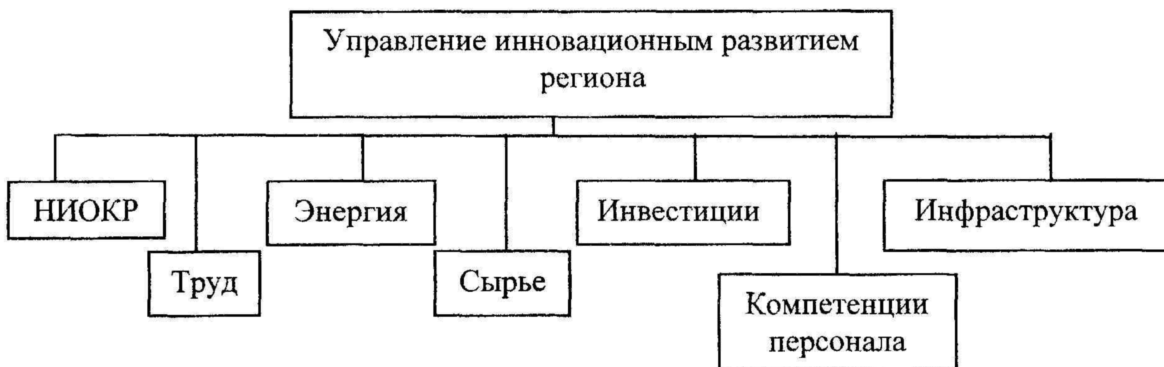
Рис. 1 Модель управления инновационным развитием региона

Формирование конкурентоспособности региона, управление его инновационным развитием в условиях глобализации российской экономики должно базироваться на совершенствовании управления основными компонентами хозяйственного механизма, т. е. трудом, энергией, сырьем и др. [1, 56]. С этой точки зрения модель управления инновационным развитием региона будет включать в себя следующие компоненты (см. рис. 1):