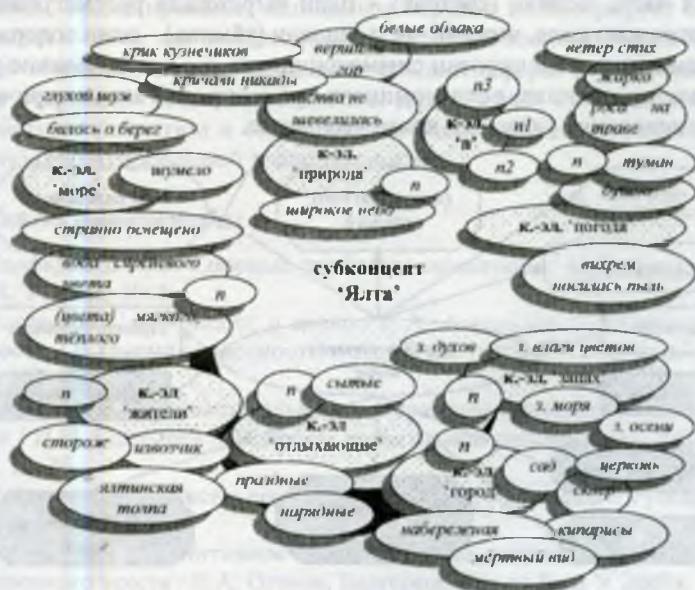
Рис. 1. Трёхуровневая модель субконцепта 'Ялта'

субконцепт 'Ялта'. Архитектоника субконцепта 'Ялта' представлена 8 концептами-элементами, имеющими, в свою очередь, многокомпонентные номинативные поля. Результаты исследования отражены в следующей трёхуровневой полевой модели субконцепта, где к.-э.л. 'п' и номинант 'п', обозначают немоделируемый материал: