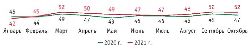
Рис. 3. Динамика производства говядины в российских сельхозорганизациях в убойной массе, тыс. т.

Динамика производства говядины за 10 месяцев 2020-2021 гг. отражена на рисунке 4.