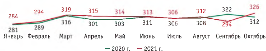
Рис. 2 – Динамика производства свинины в российских сельхозорганизациях в убойной массе, тыс. т.

В последние годы производство свинины в стране демонстрирует положительную динамику, при этом прогнозируется, что через 5 лет объем достигнет 1 млн. тонн (рис. 2).