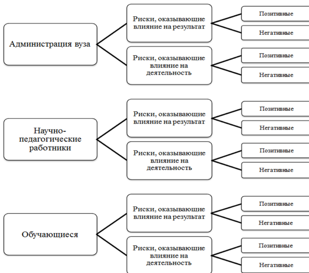
Рис. 2. Риски в управлении региональным вузом Fig. 2. Risks in the management of a regional university

личия не являются случайными, и, очевидно, могут быть объяснены спецификой статуса когорт в образовательном пространстве вуза, которая превращается в значимый фактор дифференциации риска. Это дает основание для классификации рисков в зависимости от акторов вузовского пространства (рис. 2).