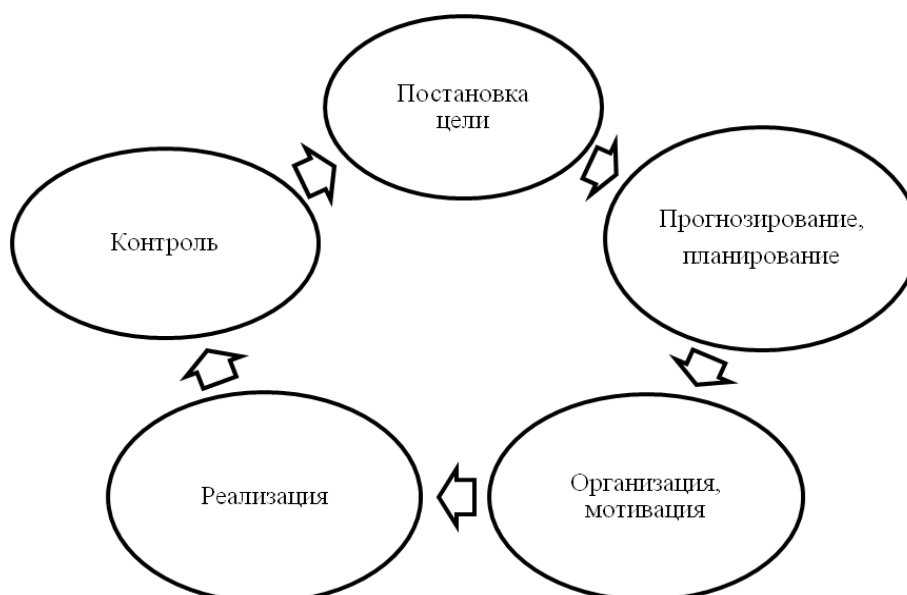
Рис. 3. Функции менеджмента (кольцо управления) Fig. 3. Management functions (the control ring)

В теории менеджмента есть такое понятие, как «кольцо управления» – наглядное представление функций менеджмента (рис. 3).