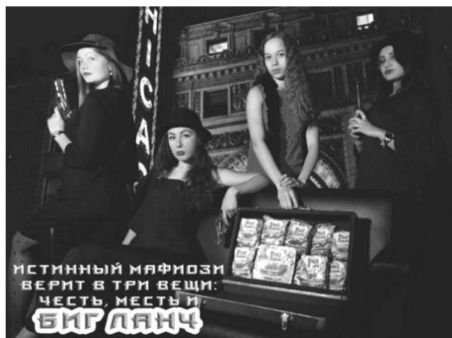
Рис. 2. Наружная коммерческая реклама, подготовленная студентами 3-го курса направления подготовки «Реклама и связи с общественностью» РГУПС Fig. 2. Outer commercial advertising prepared by the students of the third course direction "Advertising and public relations", Rostov State University of Railway Transport

Используется платформа "You Tube" и для формирования теоретической базы учащихся в сфере рекламы. Например, изучая виды рекламных видеороликов, мы демонстрируем студентам яркие примеры вирусной, коммерческой, имиджевой, социальной рекламы, чтобы они лучше понимали отличия одного вида рекламы от другого. Таким образом студенты с помощью визуальных примеров лучше воспринимают теоретическую информацию.