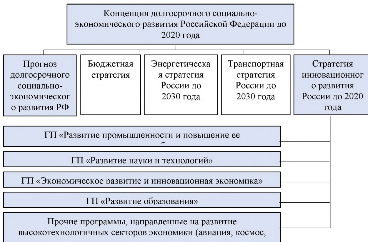
Рис. 1. Инновационное развитие в системе стратегического планирования Российской Федерации Fig. 1. Innovative development in the system of strategic planning of the Russian Federation

Как видно из представленных в таблице 2 определений, не все отечественные авторы, труды которых были проанализированы, связывают институты развития с инновациями, инновационной политикой или инновационной экономикой. Тем не менее, Министерство экономического развития при определении данного понятия упоминает о стимулировании инновационных процессов. Таким образом, предположим, что институты развития, в узком понимании «особых» организаций или организационно-экономических структур, должны быть направлены не только на распределение ресурсов (в большей части бюджетных средств), но и на развитие инноваций. В целях обоснования данной гипотезы, обратимся к стратегическим документам инновационного развития (рис. 1).