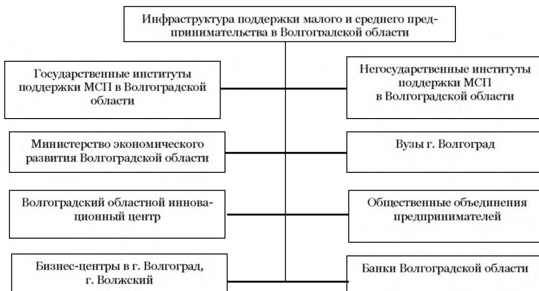
Рис. 3. Инфраструктура поддержки субъектов предпринимательства Волгоградской области

Инфраструктура помощи предпринимательству в Волгоградской области развивается согласно программам, реализуемым Министерством финансового развития Волгоградской области и Волгоградской торгово-промышленной палаты, социальных объединений предпринимателей, фондов, специальных центров и разных консалтинговых структур, представленных на рис. 3.