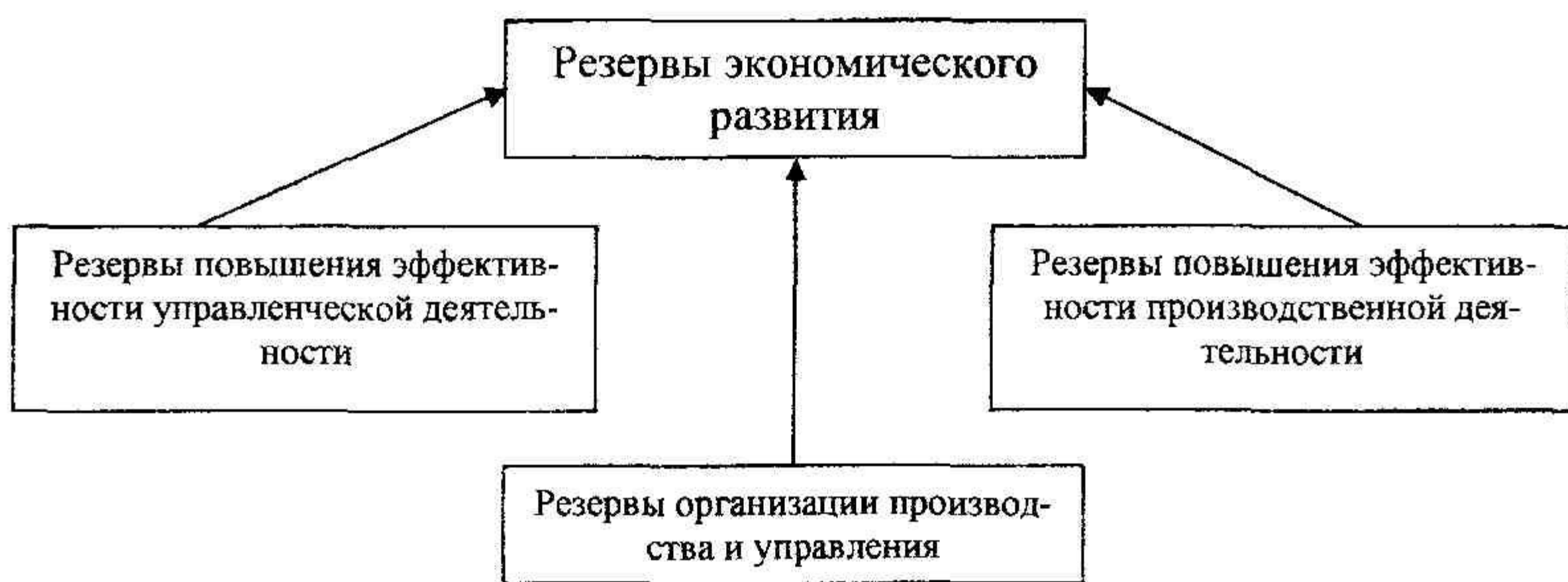
Рис. 2. Структура резервов экономического развития

ляющими обстоятельствами и необходимыми факторами обеспечения конкурентоспособности продукции, конкурентной устойчивости, и социальной достаточности предприятия за счет роста потенциала его конкурентоспособности. Поскольку резервы экономического развития являются экономическим результатом эффективности организационной и производственно-управленческой деятельности, то их структуру разделим на три блока, т.е. резервы организации производства и управления им, резервы повышения эффективности управленческой деятельности и резервы повышения эффективности производственной деятельности (Рис. 2.):