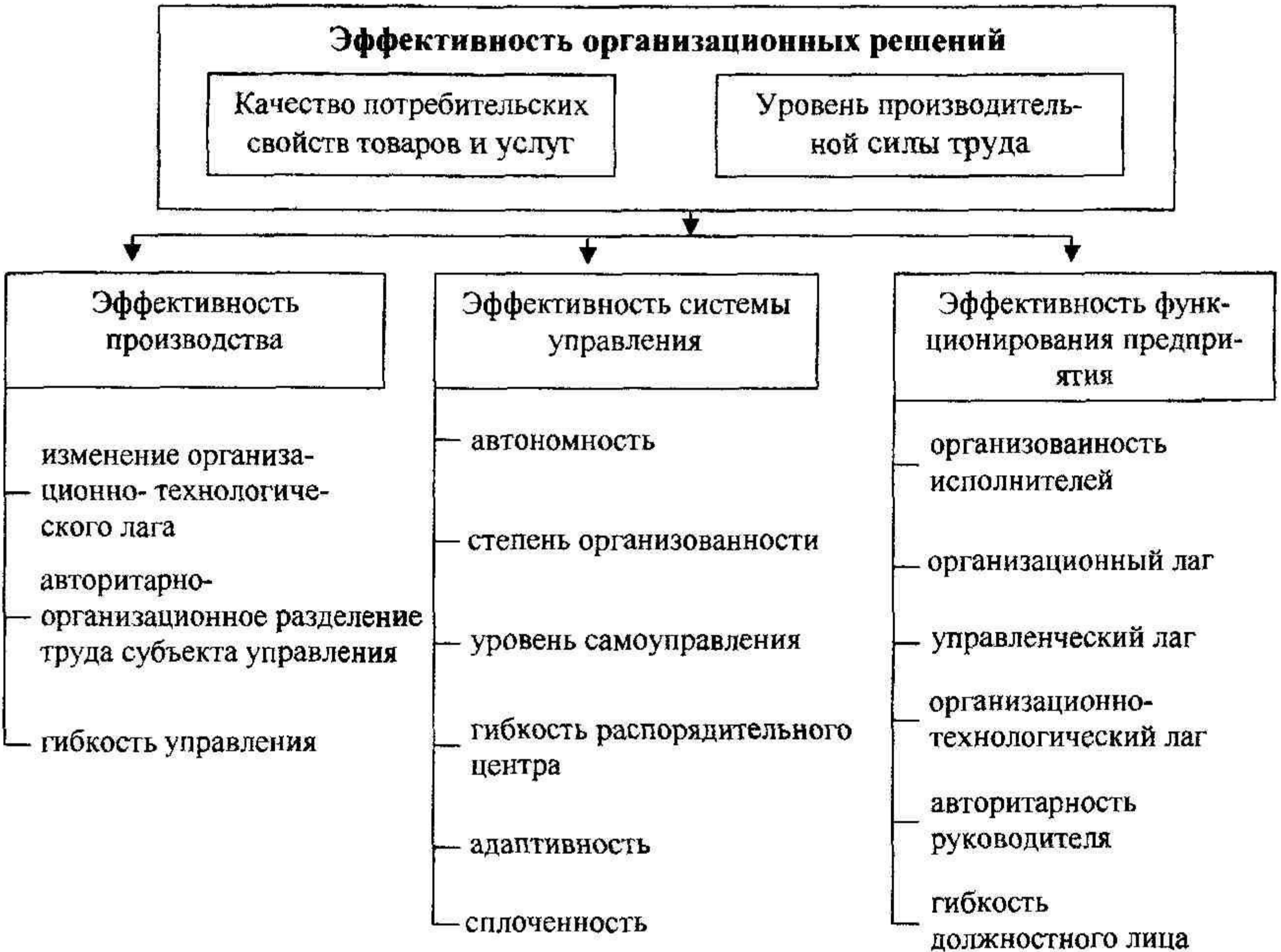
Рис. 3. Эффективность организационных решений управления

Эффективность организационных решений и управления предприятием является функцией эффективности производства, эффективности функционирования организации и эффективности системы управления предприятием (Рис. 3.).