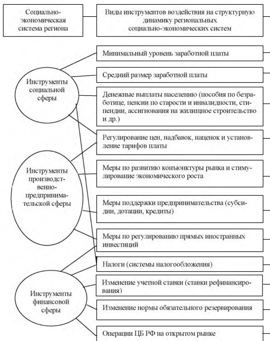
Рис. 1. Виды инструментов воздействия на структурную динамику социально-экономической системы региона Fig.1. The types of instruments of influence on the structural dynamics of socio-economic system of the region

При этом следует учесть, что выделение данных инструментов воздействия на структурную динамику социально-экономической системы региона в разрезе конкретных сфер является весьма условным и, несомненно, каждый инструмент прямо или косвенно влияет на все элементы социально-экономической системы региона и может быть систематизирован в следующие виды (табл. 2).