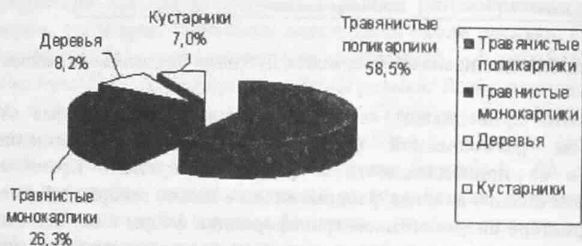
Рис. 3. Анализ жизненных форм флоры леса Дубровки Красненского района по И.Г. Серебрякову.

Анализ типологической структуры, в целом, подтверждает выводы, сделанные на основании изучения таксономической структуры флоры. По общему габитусу и продолжительности жизненного цикла в изученной флоре преобладают травянистые поликарпики 58,5%, что свидетельствует о фоновом влиянии местной флоры.