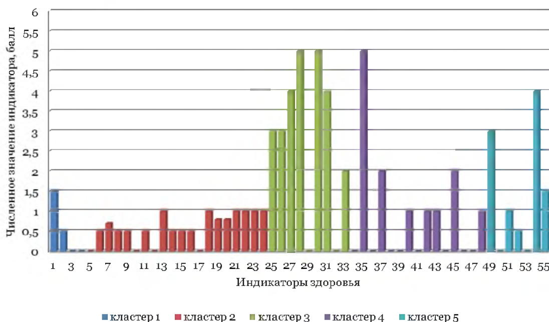
Рис. 3. Визуальный образ состояния здоровья пациента В., 74 г.

Этот клинический случай наиболее ярко демонстрирует разнородность результатов оценки П с помощью различных методик и возможное занижение ее степени, по сравнению с МКОП, при использовании методик CIRS, Kaplan-Feinstein и, в особенности, – Charlson.