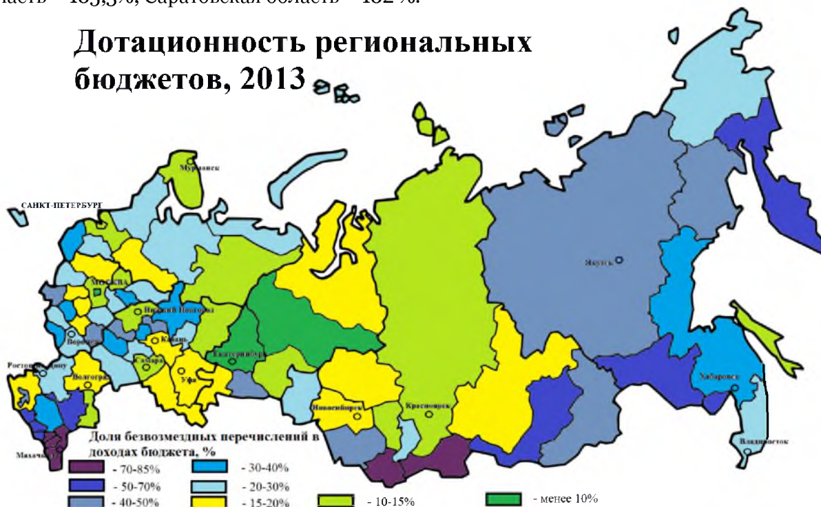
Рис. 2. Дотационность бюджетов субъектов РФ по итогам 2013 года. [7]

Несмотря на меры, предпринимаемые Министерством финансов по сокращению безвозмездных перечислений, долги регионов продолжают расти. Лидеры роста государственного долга среди регионов Центрального федерального округа показаны в табл. 1.