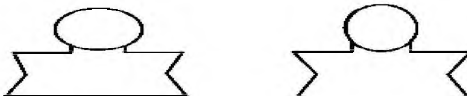
Рис. 3. Субъективный образ тела и объективные показатели конституции испытуемых озабоченного типа привязанности к матери

На основании данных таблицы 6 были спроектированы рисунки образа физического «Я» и реального тела для сравнения.