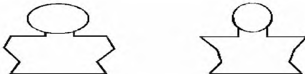
Рис. 4. Субъективный образ тела и конституция испытуемых дистанцированного типа привязанности к матери

На основании данных, представленных в таблице 8, построены рисунки образа физического Я и реального тела группы дистанцированного типа эмоциональной привязанности к матери.