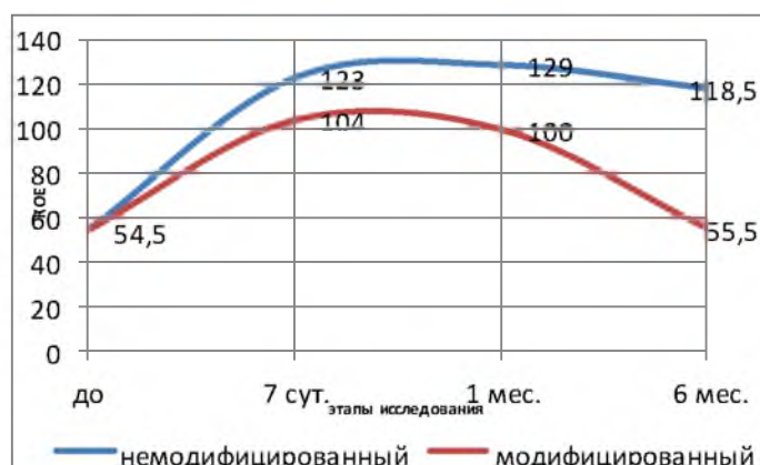
Рис. 2. Динамика колонизации слизистой оболочки ротовой полости золотистым стафилококком у пациентов детского возраста в условиях эксплуатации съёмных ортодонтических аппаратов с базисом из немодифицированного и модифицированного акрилового полимера

Динамические изменения показателя «Staphylococcus aureus» в условиях применения съёмных ортодонтических аппаратов из немодифицированного и модифицированного полимера визуализированы на рис. 2.