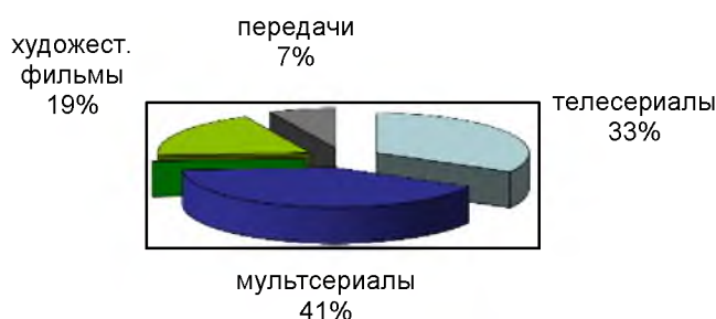
Рис. 3 Соотношение программ на канале "Дисней" в будние дни

Телеканал «Disney» ранее конкурировал с «Каруселью», однако в последнее время канал позиционирует себя, как канал семейного и детского просмотра. В будни эфир состоит из развлекательных мультсериалов, фильмов, передач, мультфильмов, телесериалов (см. рис. 3).