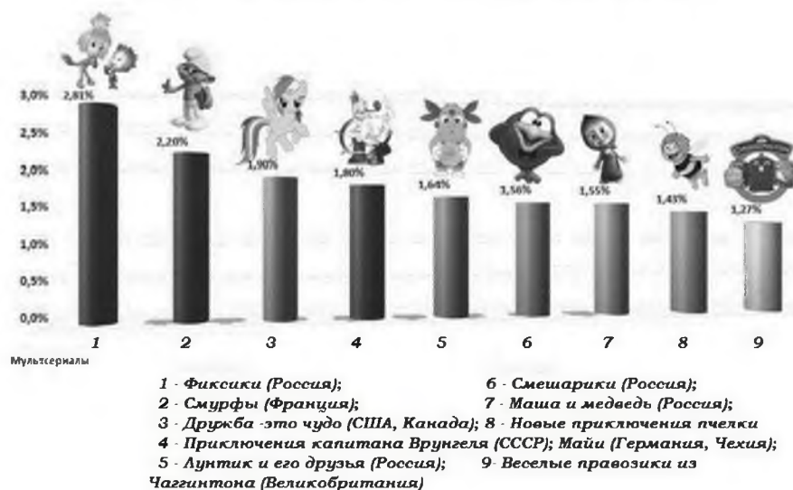
Рис.2 Рейтинг лицензионных мультсериалов телеканала «Карусель»

Второе место среди детского контента канала занимают передачи. По функциям можно выделить следующие передачи: обучающие (15 передач), познавательные (13 передач), развлекательные (61 передача). По тематическим направлениям можно выделить следующие передачи: