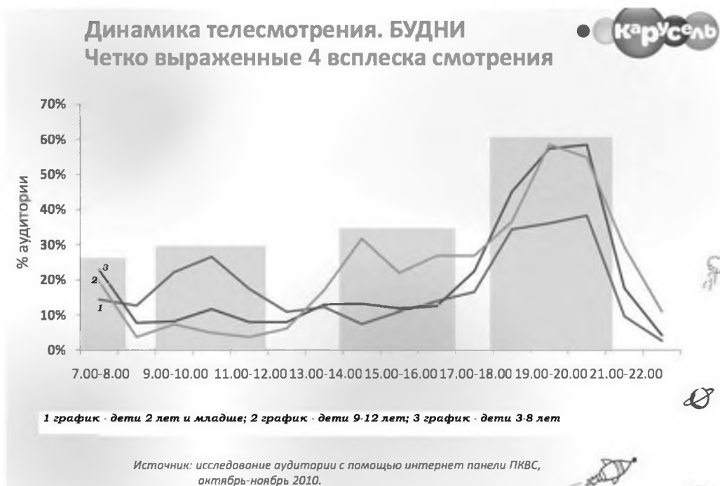
Рис. 1 Динамика телесмотрения канала «Карусель»

Начнем с анализа телеканала «Карусель». Телеканал имеет четыре четких всплеска телесмотрения в будни (см. рис. 1).