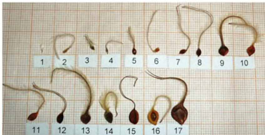
Рис. 1. Плодики видов ломоносов в порядке увеличения их длины:

Плодики снаружи опушены и окаймлены симметричными по длине крыловидными выростами. Более густые и длинные волоски характерны для представителей секций Meclatis , Clematis и Integrifoliae (см. рис. 2). При микроскопическом сканировании поверхности плодиков лучше заметны различия в характере опушения. У видов секции Clematis трихомы экзокарпия различаются длиной и густотой в разных частях. У представителя секции Novae-Zeelandiae – C. paniculata – трихомы короткие, едва заметны без увеличения (рис. 2 ж). У вида C. heracleifolia подрода Tubulosae редкие трихомы без увеличения незаметны (рис. 2 н). Виды ломоносов секции Viorna отличаются густотой опушения: у плодиков C. fusca опушение войлочное (рис. 2 о), у C. viorna трихомы более короткие и редкие (рис. 2 р).