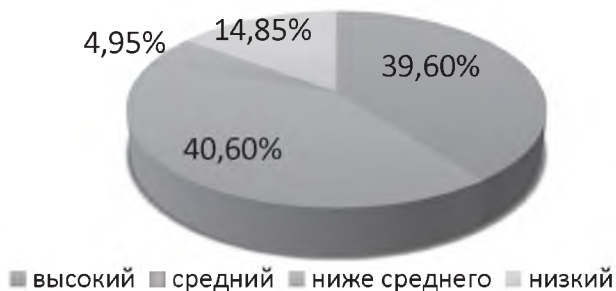
Рис. 3. Уровень совестливости спортсменов на этапе спортивной специализации в СБЕ (ММА)

Анализ данных, полученных по методике «Шкала совестливости», представленных на рис. 3, подтверждает, что «высокий» уровень — у 39,60 % занимающихся, «средний» — у 40,60 %, что составляет значимую часть спортсменов СБЕ (ММА). В то же время уровень «ниже среднего» составляет у 4,95 % занимающихся, а у 14,85 % спортсменов — показатели совестливости находятся на «низком» уровне.