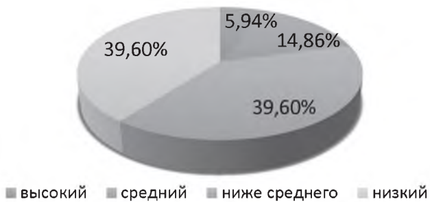
Рис. 1. Уровень нравственной самооценки спортсменов на этапе спортивной специализации в СБЕ (ММА)

Полученные результаты диагностики уровня сформированности толерантности, позволяют сделать вывод о том, что у подавляющего большинства спортсменов (96,04 %) отмечается невысокий уровень толерантности (рис. 2.).