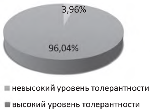
Рис. 2. Уровень сформированности толерантности спортсменов на этапе спортивной специализации в СБЕ (ММА)

Полученные результаты диагностики уровня сформированности толерантности, позволяют сделать вывод о том, что у подавляющего большинства спортсменов (96,04 %) отмечается невысокий уровень толерантности (рис. 2.).