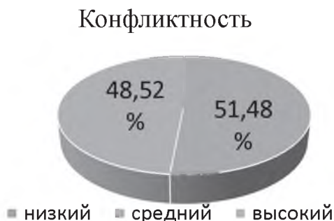
Рис. 5. Уровень конфликтности спортсменов на этапе спортивной специализации в СБЕ (ММА)

единоборцев необходимо вводить философские и этические кодексы, включающие медитацию, правила поведения на соревнованиях для закрепления нравственных ценностей, что способствует снижению гнева и агрессии [19; 20].