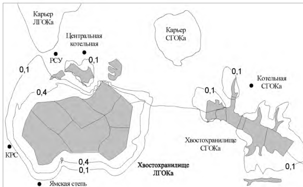
Рис. 2. Прогнозная концентрация нефтепродуктов в альб-сеноманском водоносном горизонте до 2022 года через 50 лет после начала сброса хвостов обогащения в хвостохранилище ЛГОКа и через 36 лет – в хвостохранилище СГОКа