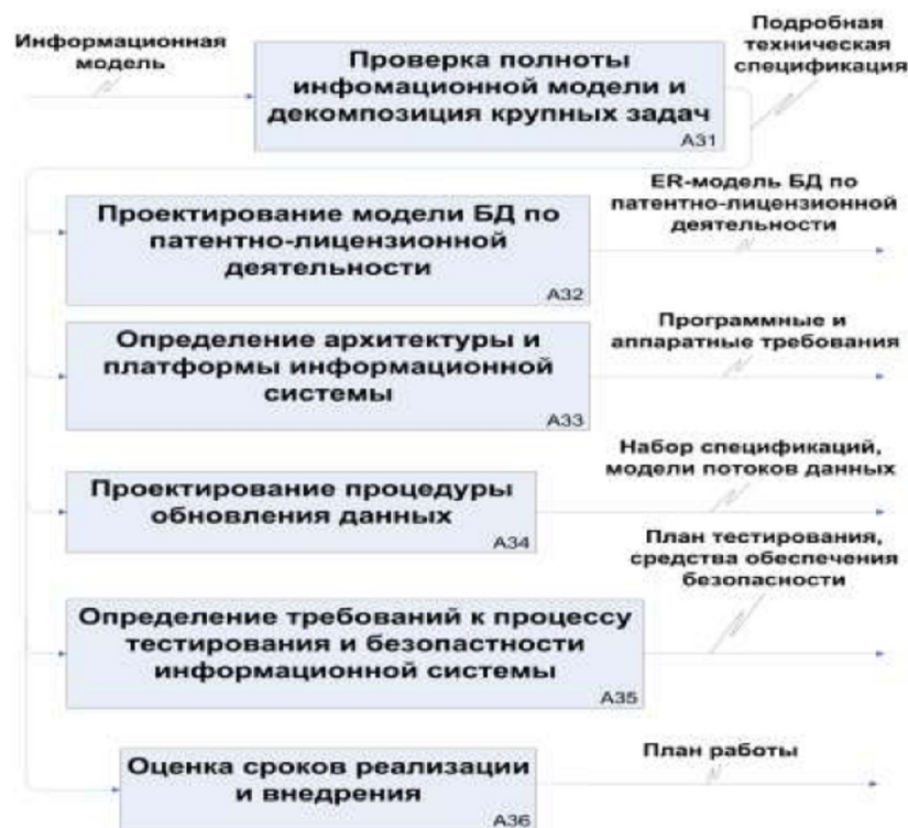
Рис. 4. Процедура проектирования информационной системы в сфере нанотехнологий

На этапе проектирования формируется модель данных (рис. 4). Проектировщики получают входные данные, найденные в результате тщательного анализа предметной области. Конечным продуктом этапа проектирования являются схема базы данных или схема хранилища данных (ER-модель) и набор спецификаций модулей системы (модель функций).