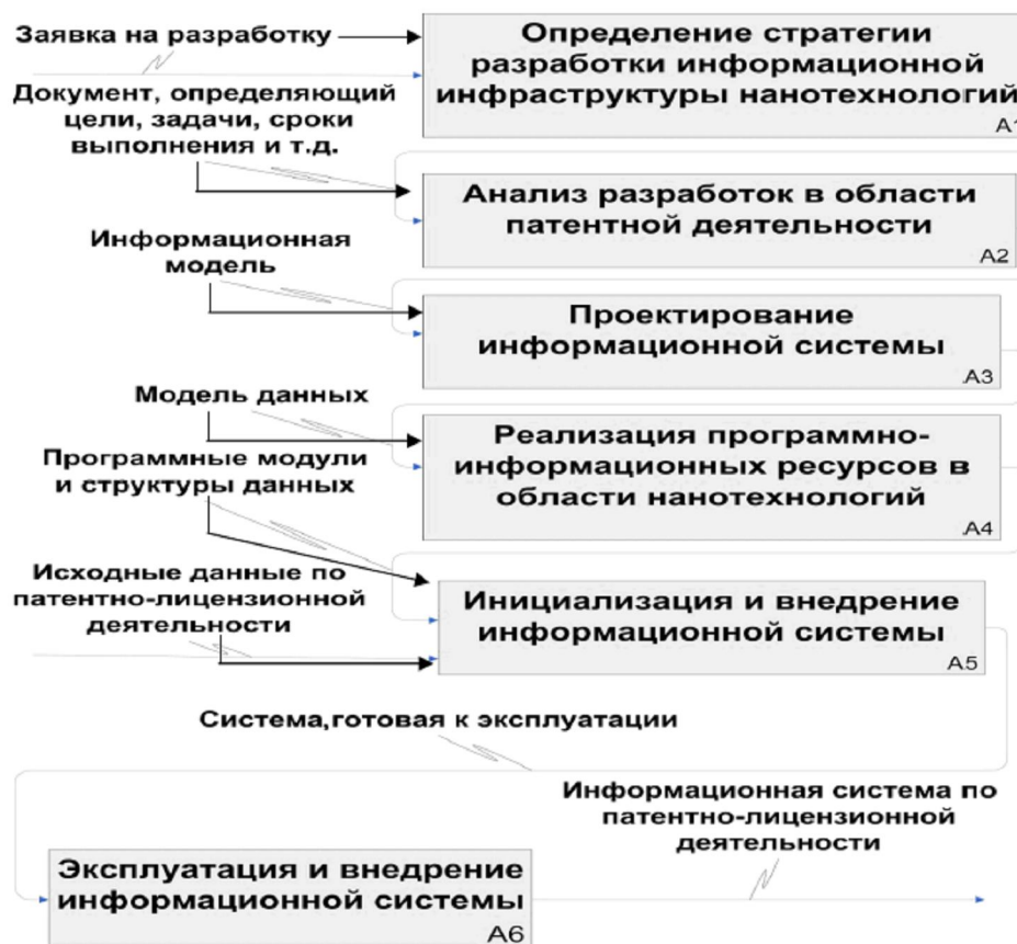
Рис. 3. Процедура построения информационной инфраструктуры нанотехнологий

На основании каскадной модели жизненного цикла по методологии IDEFO [5] была построена модель процедуры проектирования и разработки информационной инфраструктуры нанотехнологий (рис. 3). Она включает в себя ряд последовательных, взаимосвязанных этапов.