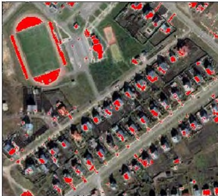
Рис. 1. Результат распознавания частных домов байесовским методом в ENVI

Одной из перспективных возможностей изменения ситуации в области автоматизированного распознавания являются разработка и внедрение программно-технологических средств, которые используют новые методы обработки космофотоснимков на основе частотных представлений.