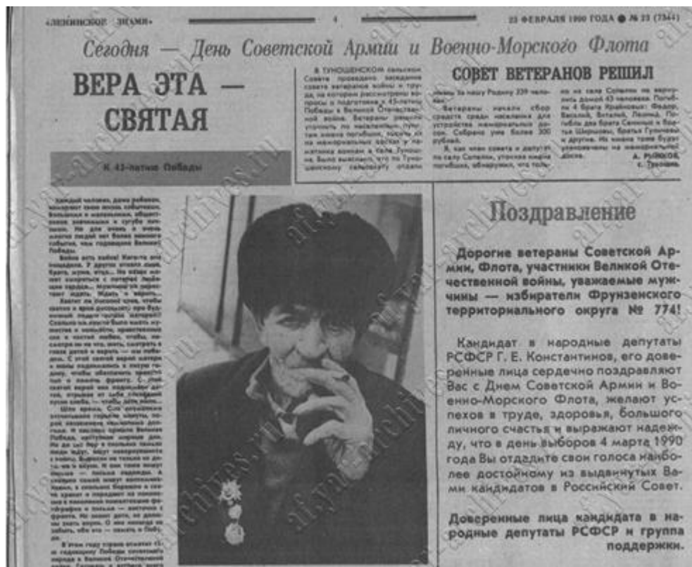
Рис. 7. Поздравление жителей Ярославского района с 23 февраля 1990 г. Источник: Ленинское знамя. Орган Ярославского районного комитета КПСС и Районного совета народных депутатов Ярославской области. 1990. 23 февраля.

Для местных изданий столь смелые суждения, в целом, пока еще были редки. Их характерной особенностью стал минорный настрой, затрагивавший, в том числе, и освещение праздников.