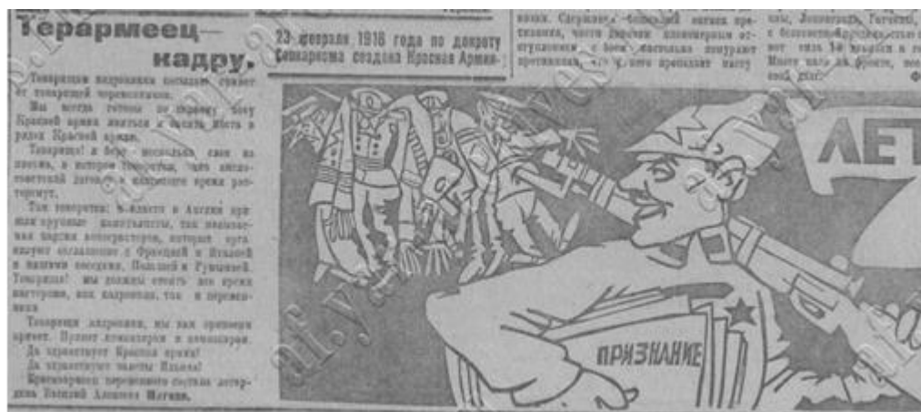
Рис. 2. Фрагмент передовицы газеты «Северный рабочий» с неверным указанием декрета о создании РККА.

Праздничные номера центральных и местных печатных изданий периода НЭПа, применительно к освещению жизни армии, оказались одними из наиболее информативных за всю советскую эпоху. Элементы красной демократии, присущие 1920-м гг., способствовали обсуждению на страницах газет наиболее злободневных проблем армии. Так, в крупнейшем ярославском издании «Северный рабочий» неоднократно затрагивались проблемы малограмотности красноармейцев, их тяжелого быта, нехватки топлива, антисанитарии и т.д. Вскрытию подобных «гнояников» способствовала развернувшаяся в масштабах отдельных красноармейских формирований деятельность военных корреспондентов (военкоров). На пике активности, пришедшейся на 1923–1925 гг., в «Северном рабочем» выходили специальные военные странички («На зимних квартирах», «На страже революции»), а также отдельная рубрика «В Красной Армии», посвященные жизни дислоцированной в Ярославской губернии 18-й стрелковой дивизии.