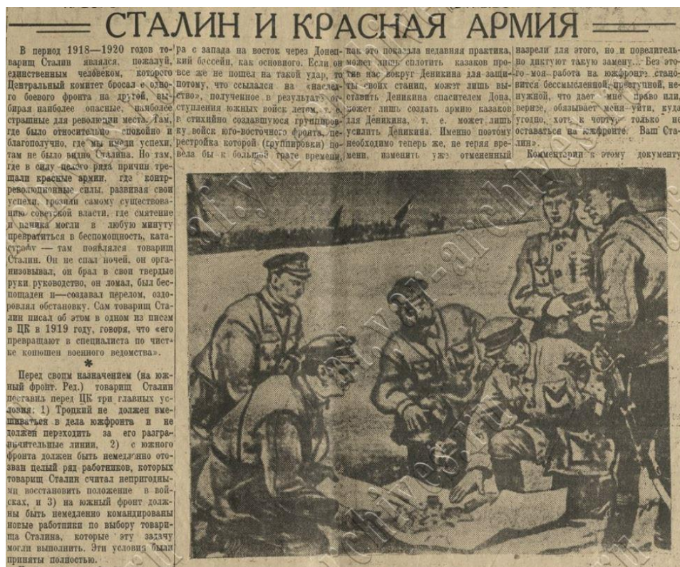
Рис. 4. Рассказ о становлении РККА в период Гражданской войны. Источник: Северный рабочий. 1936. 23 февраля.

В этот же период завершённые очертения принял порядок подачи информации на страницах местных периодических изданий. Номера газет, приуроченных к 23 февраля, традиционно начинались с обращения центрального, либо местного политического руководства, а также приказа наркома (позднее - министра) обороны о проведении праздника. Далее следовала достаточно пространная повестка торжеств, сведения о неизменном росте боевой силы Красной Армии и т.п. Первый разворот повествовал о проведении праздника в масштабах региона, сопровождаясь характерными отчётами об успехах в военном строительстве, обращениями трудящихся к руководству страны (вроде: «Москва ЦК ВКП(б) товарищу Сталину – от трудящихся Ярославля»), сообщениями о присвоении званий героя Советского Союза, вручении наград, а также рассказами про красноармейцев-отличников военной и политической подготовки. Характерной приметой 1930-х гг. и более позднего периода стали производственные и учебные обязательства: «Годовщину Красной армии рабочие Ярославля встретили новым про-