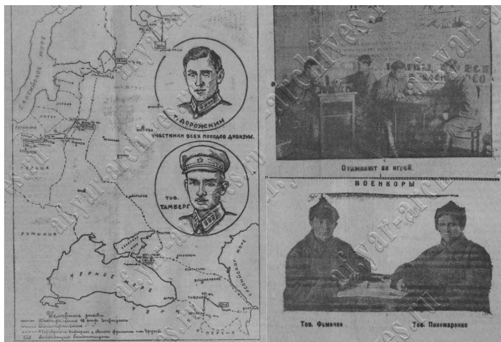
Рис. 3. Боевой путь 18-й Ярославской стрелковой дивизии, фотографии из жизни дивизии.

К концу 1920-х гг. наполнение периодических изданий все более стало соответствовать генеральной линии партии. Со страниц газет практически исчезли экскурсии в жизнь расквартированных в регионе частей, прекратились регулярные заметки военкоров. В то же время усилился пропагандистский дискурс праздника, обусловленный задачами, стоявшими перед государством. Постоянной темой газетных публикаций 1930-х гг. стало укрепление обороны страны посредством масштабного индустриального строительства. Широко освещалось участие граждан в спортивных и допризывных обществах – подчеркивалось исключительное значение ОСОВИАХИМа. Заметки об освоении новой техники постоянно переключались с рассказами о «стахановцах боевой подготовки». Все более отчетливо звучала тема подготовки страны к грядущей войне: «На планере, в тире, у станка» 10 . В то же время характер подачи информации определялся установившимся в стране культом личности Сталина. Периодические издания восхваляли «исключительный» вклад Сталина в победы Красной Армии.