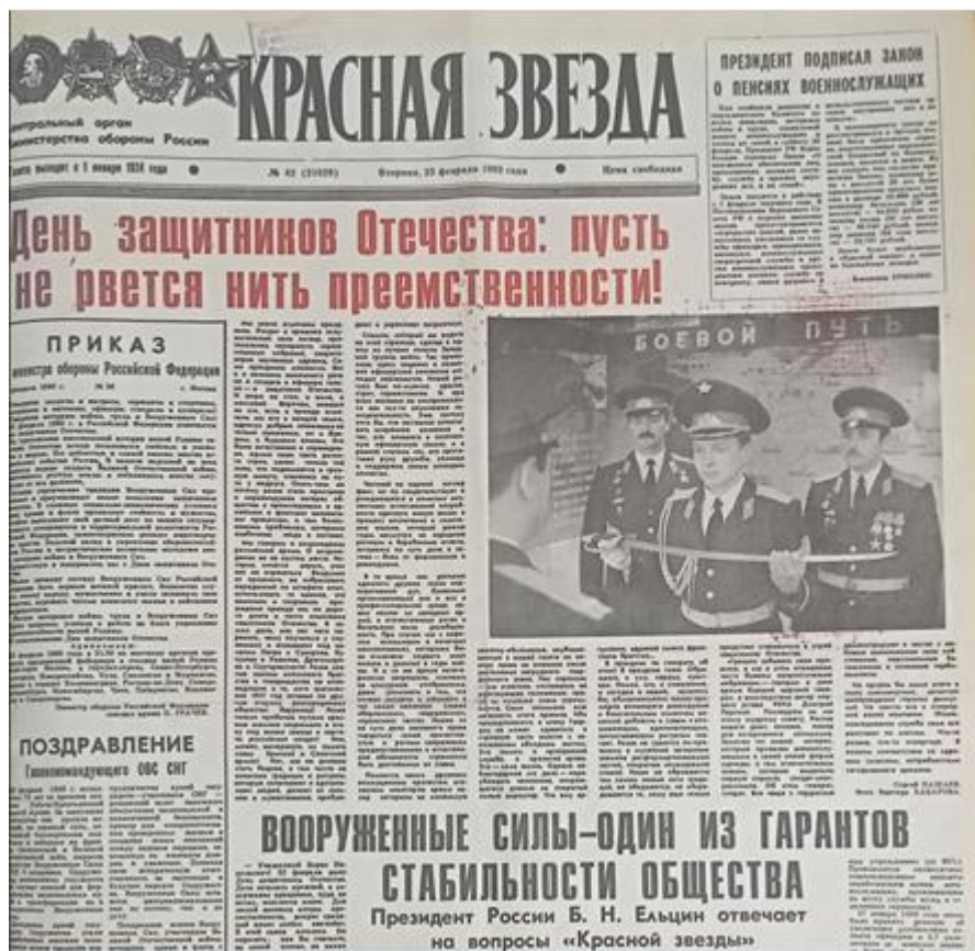
Рис. 8. Поздравление с вновь установленным Днем защитника Отечества.