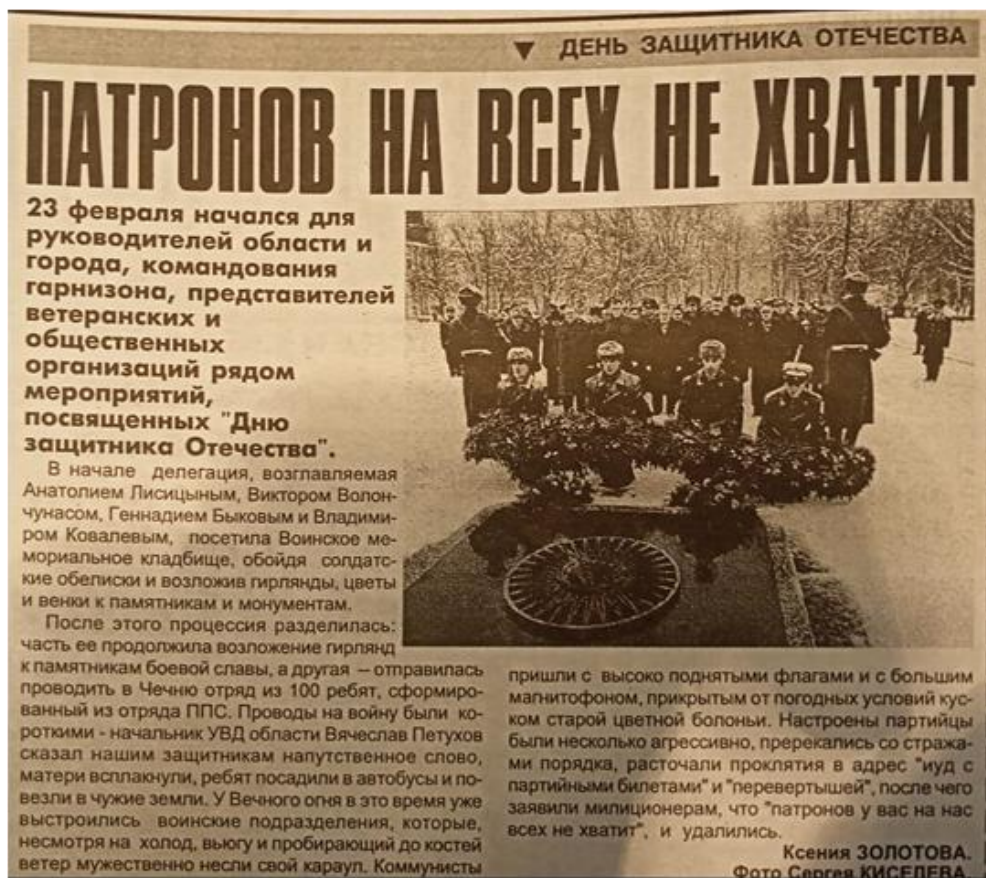
Рис. 9. В 2000 г. праздник прошел на фоне отправки отряда ППС в Чечню и протестов ярославских коммунистов.

Изменилась и официальная оценка роли Вооружённых Сил РФ в деле государственного строительства. В праздничный день писатель и поэт, полковник запаса В.А. Маркушин на страницах «Красной звезды» сравнивал современных ему российских военных с героем романа-эпопеи графа А.Н. Толстого «Война и мир» капитаном Тушиным. Как и литературный персонаж, офицер – это «защитник Отечества, незаметный, маленький, неприветливый, но внутренне всегда готовый к самопожертвованию». Именно такими людьми публицист считал тех россиян, кто добровольно сражался и погибал за целостность и безопасность страны в Чечне, констатируя позитивные перемены в отношениях государства и армии. Он считал, что Россия начинает «преодолевать самую позорную полосу бесцеремонного нигилизма по отношению к армии и её проблемам». Причину таких перемен Маркушин видел в осо-