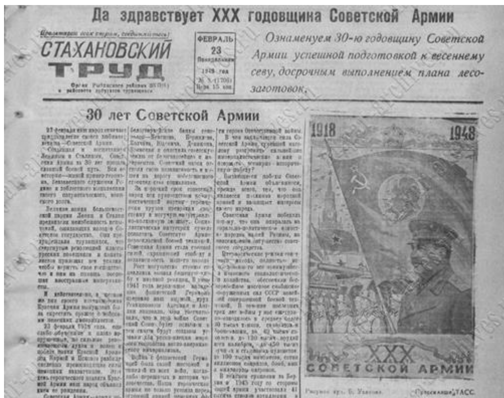
Рис. 5. Заметка о 30-лети Советской Армии в газете Рыбинского района ВКП(б).

Началось освещение темы героев Великой Отечественной войны (значительные масштабы это приобретет после 20-летнего юбилея в 1965 г.), а также подготовки новой смены защитников Отечества. В контексте последнего, в «Северном рабочем» в 1946 г. вышла заметка «В Ярославском пехотном училище» с рассказом об одном дне из жизни этого учебного заведения (училище существовало в 1940–1957 гг., с 1941 г. – в Ярославле) 21 .