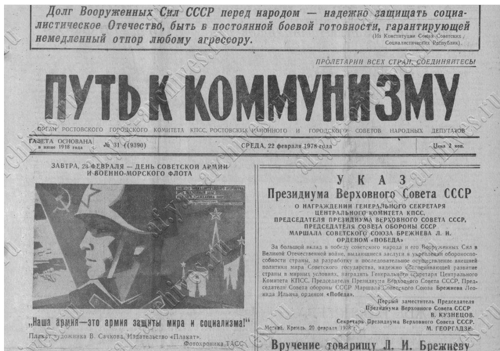
Рис. 6. Передовица ростовской газеты о праздновании годовщины Советской Армии и флота.

В 1960-1980-е гг. День Советской Армии и Военно-Морского флота официально оставался профессиональным праздником военных. В то же время, в силу прохождения большинством советских мужчин срочной службы в армии, праздничная дата все более приобретала статус общенародного торжества. В сознании граждан постепенно укоренялась установка: «Все мужчины – защитники Отечества». Возникла традиция поздравлять с Днем Советской Армии все мужское население страны, независимо от возраста и рода деятельности. По аналогии с 8 марта 23 февраля приобрел гендерный статус. При этом на протяжении всего советского периода так и не сложилось четко определенных традиций его празднования.