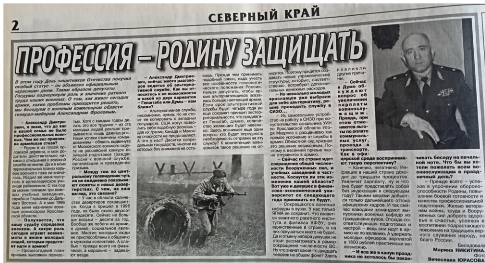
Рис. 10. В 2002 г. наряду со статусом официального выходного на страницах прессы активно обсуждалась тема альтернативной службы. Источник: Северный край. 2002. 22 февраля