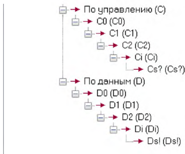
Рис. 2. Иерархии потоков управления и отчетных данных Fig. 2. Hierarchies of control flows and reporting data