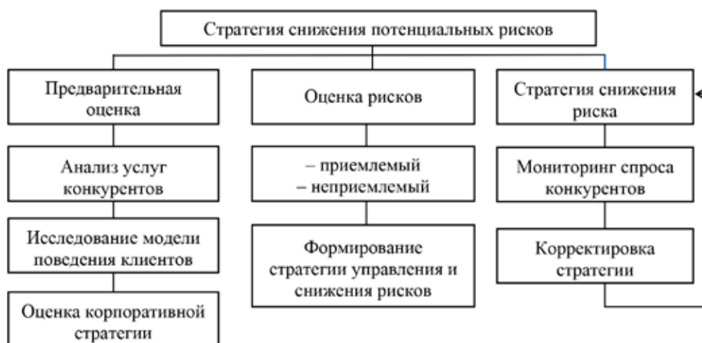
Рис. 2. Визуализация стратегии управления рисками