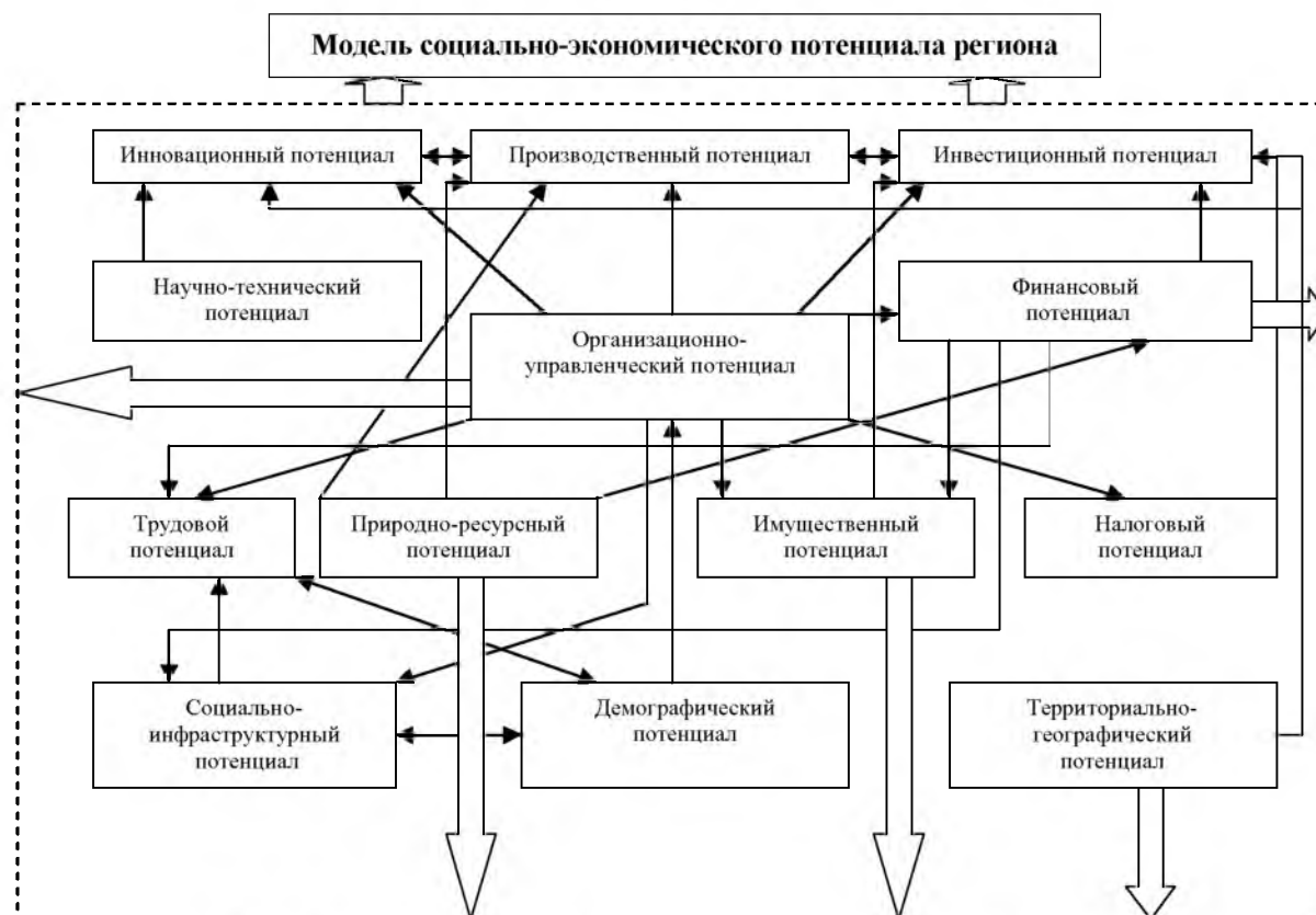
Рис. 3. Модель социально-экономического потенциала региона

По нашему мнению, в современных условиях необходимо отходить от сложившихся традиционных схем оценки социально-экономического потенциала региона, учитывая, что формирование рынка и цивилизованных рыночных отношений во многом определяются организационно-управленческими решениями, тем, что все частные потенциалы взаимодействуют и взаимодополняют друг друга, развивая сложившиеся и создавая новые конкурентные преимущества регионального развития. Структуру и характер взаимодействия частных показателей социально-экономического потенциала представим схематично (рис. 3).