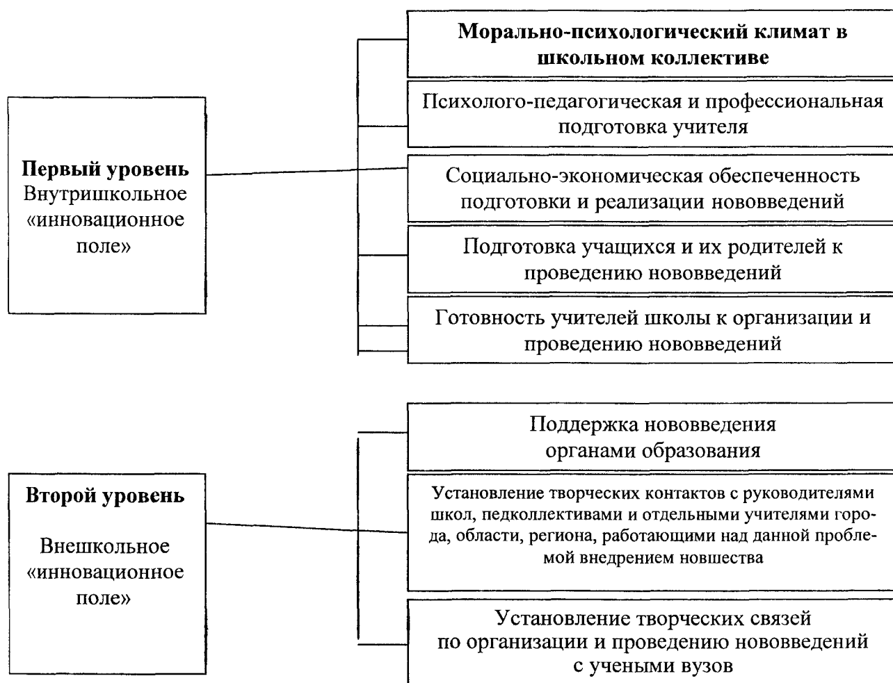
Рис. 1. Модель формирования «инновационного поля»

Организационные условия интенсифицируют в соответствии с потребностями учителей и целями системы повышения квалификации все имеющиеся внешние и внутренние ресурсы профессионального развития учителей. В этом мы убедились на практике, исходя из разработанной модели формирования инновационного поля (рис. 1).