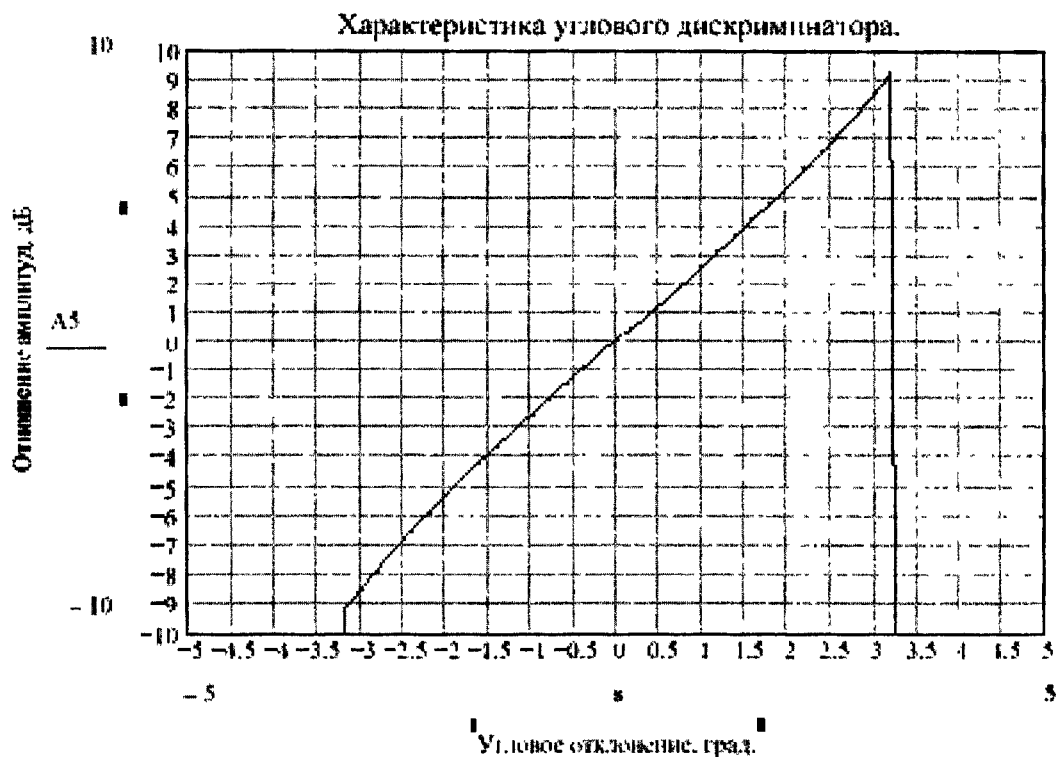
Рис. 3. Логарифм отношения амплитуд в зоне углового дискриминатора.