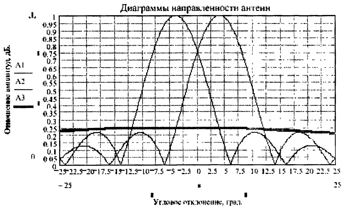
Рис. 4. Соотношение амплитуд сигналов на выходе антенн амплитудного моноимпульсного пеленгатора относительно уровня сигналов антенны системы ПБЛ в области равносигнального направления и ближних боковых лепестков.

В связи с этим разработка алгоритмов оценки угловой координаты методом определения отношений амплитуд спектров ограниченных выборок сигналов на выходе ЧВА и инвариантных к виду модуляции сигналов является в общей постановке неразрешимой задачей ввиду ее нелинейности, многовариантности и сложности математической формализации.