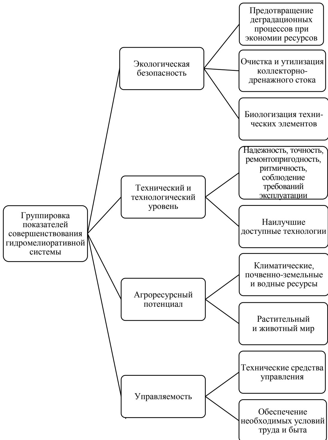
Рис. 3. Группировка показателей совершенствования гидромелиоративной системы Fig. 3. Grouping of indicators for improving the irrigation and drainage system