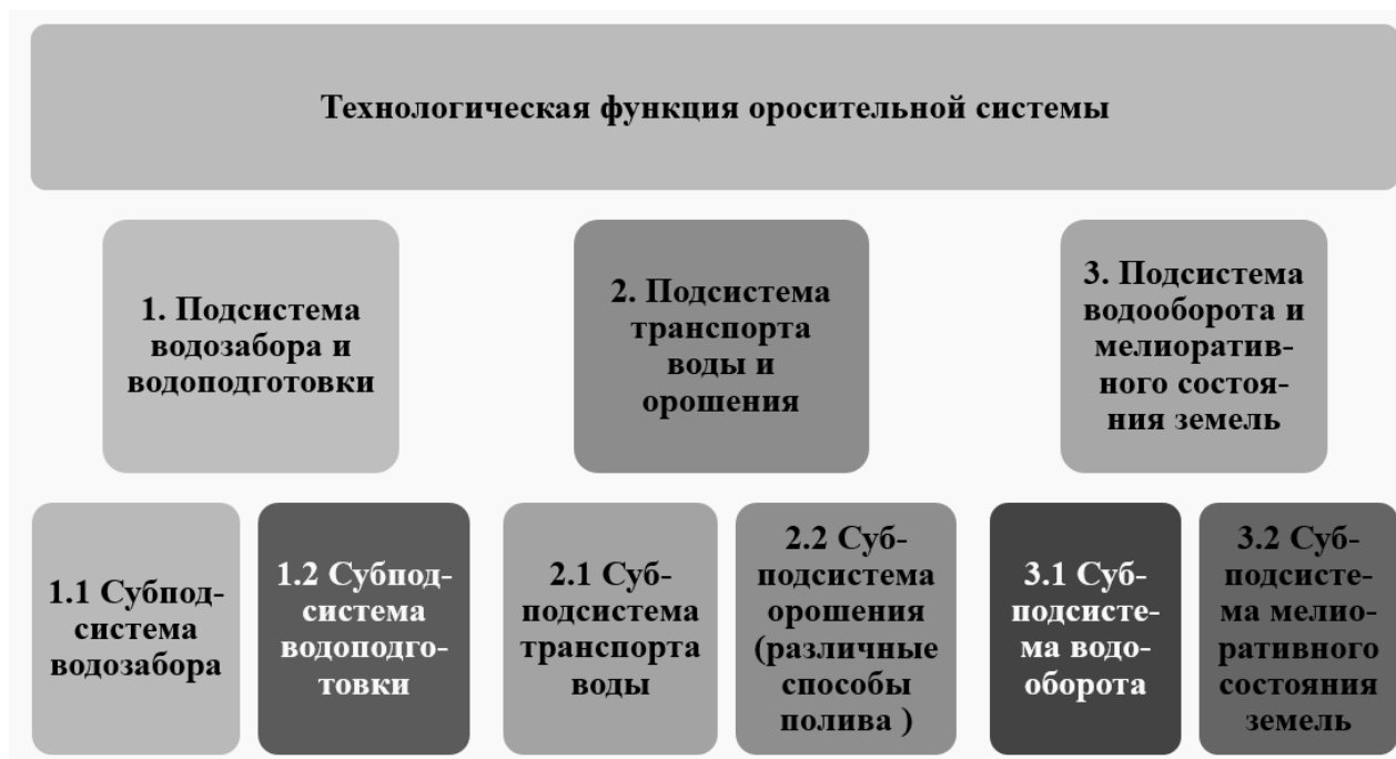
Рис. 1. Взаимосвязанность подсистем, выполняющих технологические функции оросительной системы Fig. 1. The interconnection of subsystems that perform the technological functions of the irrigation system

Отношения вложенности (свойство вложенности младшего уровня подсистем в старший уровень) характерны для агролесомелиоративных (инженерно-биологических) систем – противодефляционных, противоэрозионных, водоохранных и др. Главенствующими и ведущими элементами таких систем служат МЛН (чаще всего лесные полосы и донные насаждения-илофилтры), способные создавать основу природоподобия инженерно-биологических систем. В эту основу вкладывают другие компоненты, образуя отношения вложенности.