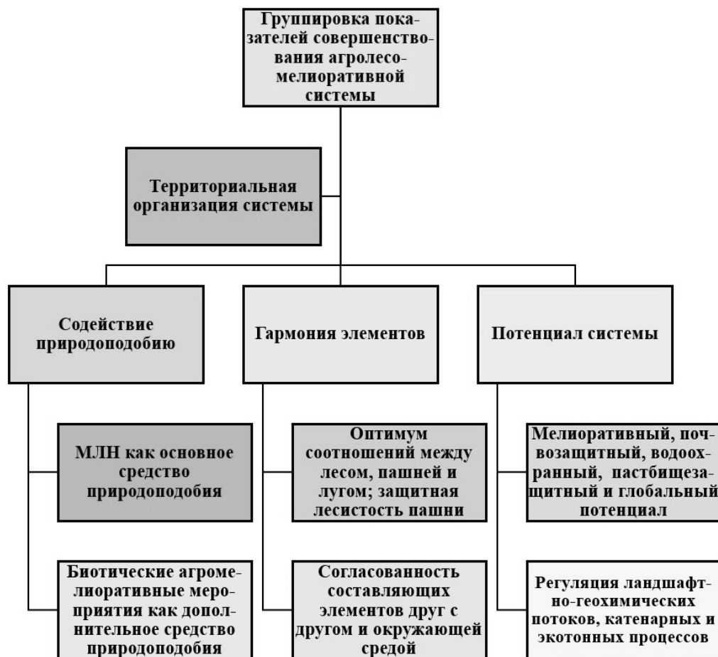
Рис. 4. Группировка показателей совершенствования агролесомелиоративной системы Fig. 4. Grouping indicators for improving the agroforestry system

Технологический уровень системы отражают наилучшие доступные технологии (НДТ), под которыми, согласно ГОСТ Р 56828.15-2016 3 , понимают «производство продукции (товаров), выполнение работ, оказание услуг, определяемые на основе современных достижений науки и техники и наилучшего сочетания критериев достижения целей охраны окружающей среды при условии наличия технической возможности ее применения». Агроресурсный потенциал проявляется в виде ресурсно-производящей способности гидромелиоративной системы для организации производственного процесса, определяясь особенностями климата (радиационный баланс, осадки), почв (запасы гумуса, NPK, pH), вод (орошение, осушение), при сохранении флоры и фауны.