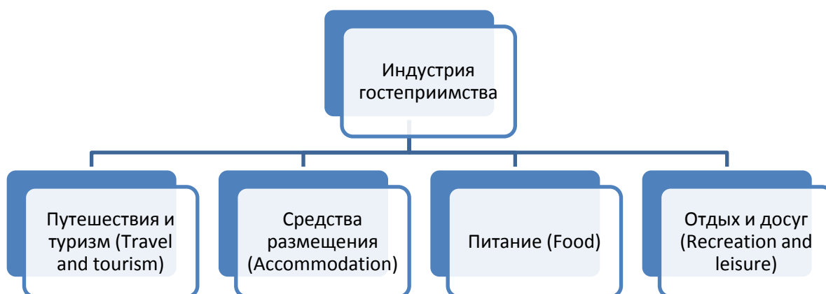
Рис. 1. Состав индустрии гостеприимства