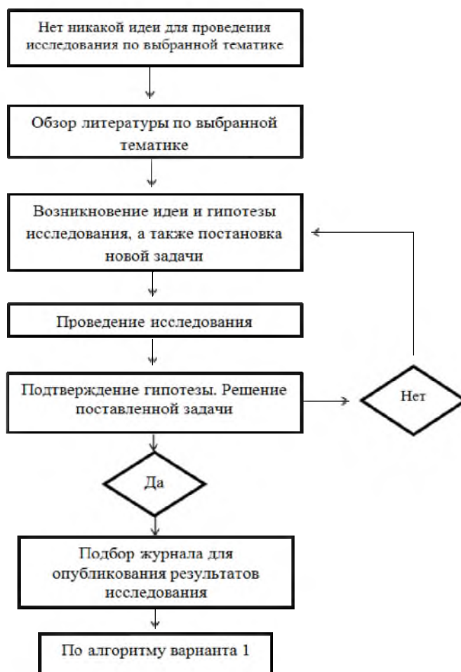
Рис. 3. Вариант 3. От идеи до продвижения опубликованной статьи.