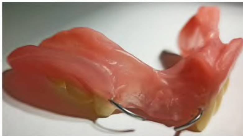
Рис. 2. Формирующий пластиночный протез Fig. 2. Forming plate removable denture

В качестве формирующей конструкции был использован комбинированный частично-съёмный пластиночный формирующий протез (патент РФ №2758179 С1), который может применяться при ортопедической реабилитации пациентов после обширных хирургических вмешательств, пострезекционных дефектов нижней челюсти, а также в случаях сложных анатомических условий или значительной атрофии альвеолярного гребня. Конструкция протеза отличается комбинацией акрилового базиса протеза с безмономерной пластмассой «Vertex» и добавлением эластичной подкладки из пропеновой кислоты горячей полимеризации «GC Soft Liner» (рис. 2). Акриловая пластмасса основной части базиса обладает необходимой жесткостью для равномерного распределения жевательного давления. Замыкающие границы базиса протеза выполнены из безмономерной пластмассы, более эластичной, чем акриловая. Эластичная подкладка, располагающаяся с внутренней стороны базиса, прилегающего к слизистой оболочке протезного ложа, исключает сдавление истонченной или поврежденной слизистой оболочки в раневой области дефекта челюсти. Моделирование эластичной подкладки в виде специального резервуара обеспечивает возможность внесения ранозаживляющего лекарственного средства.