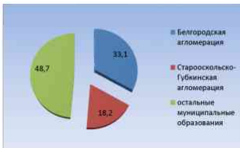
Рис. 2. Соотношение земель населенных пунктов, % от общей площади данной категории Белгородской области в двух агломерациях и за их пределами Fig. 2. The ratio of the land of localities, % of the total area of this category of the Belgorod region in the two agglomerations and beyond

Статистические данные, отражающие динамику исследуемых приграничных областей ЦЧР по землям населенных пунктов, свидетельствуют о том, что за анализируемый период рыночных преобразований, связанных с введением частной собственности на землю, наблюдается тренд неуклонного роста землепользования в соответствии с Классификатором видов разрешенного использования земельных участков в виде жилой застройки, которая интенсивно развивается в пригородной зоне. Жилая застройка пригородных территорий характеризуется широким спектром видов разрешенного использования земельных участков, а именно: земельные участки для индивидуального жилищного строительства, малоэтажная многоквартирная жилая застройка, блокированная жилая застройка, среднеэтажная жилая застройка, многоэтажная жилая застройка (высотная застройка) [Об утверждении..., 2020].