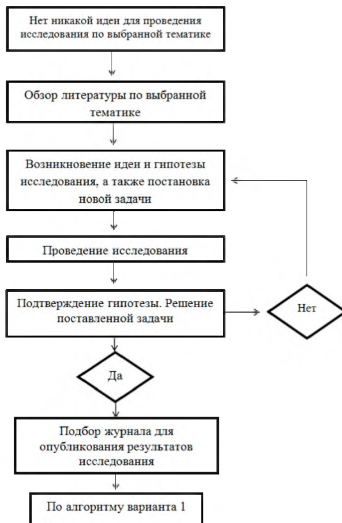
Рис. 3. Вариант 3. От идеи до продвижения опубликованной статьи