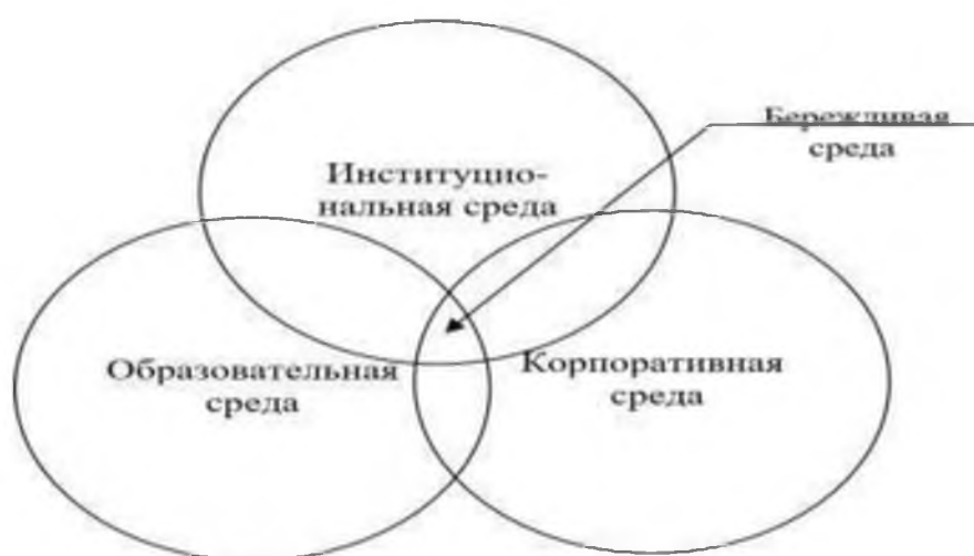
Рис. 3. Модель формирования «бережливой среды» региона Fig. 3. The model of formation of lean environment in the region

Для определения элементов «бережливой среды» региона, как основы внедрения бережливого производства в масштабах региона, мы предлагаем использовать универсальную модель «тройной спирали» [Etzkowitz Н., 2000]. Тройственная спираль отражает взаимодействия трех ключевых составляющих. Согласно рассмотренной модели, целесообразно «бережливую среду» представить в качестве взаимосвязи трех составляющих: институциональная, корпоративная и образовательная среда (рисунок 3).