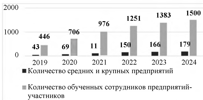
Рис. 1. Планируемые показатели проекта по количеству предприятий-участников национального проекта и обученных сотрудников инструментам повышения производительности труда Белгородской области, ед. нарастающим итогом

производительности труда нарастающим итогом должен составить 1,5 тысяч человек (рис. 1).