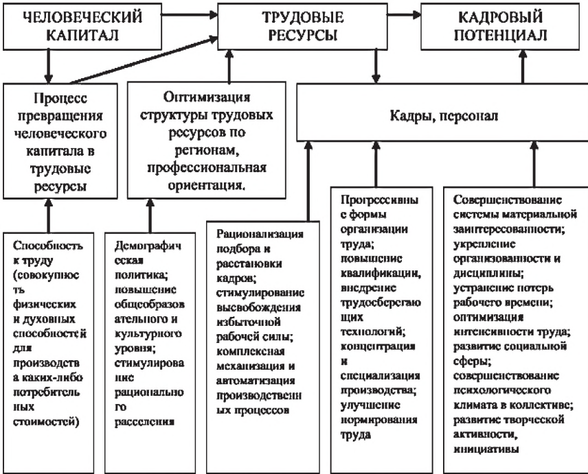
Рис. 1. Процесс формирования кадрового потенциала [4].