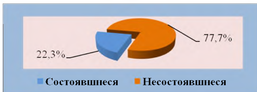
Рис. 1. Структура процедур централизованных закупок Орловской области в 2018 году