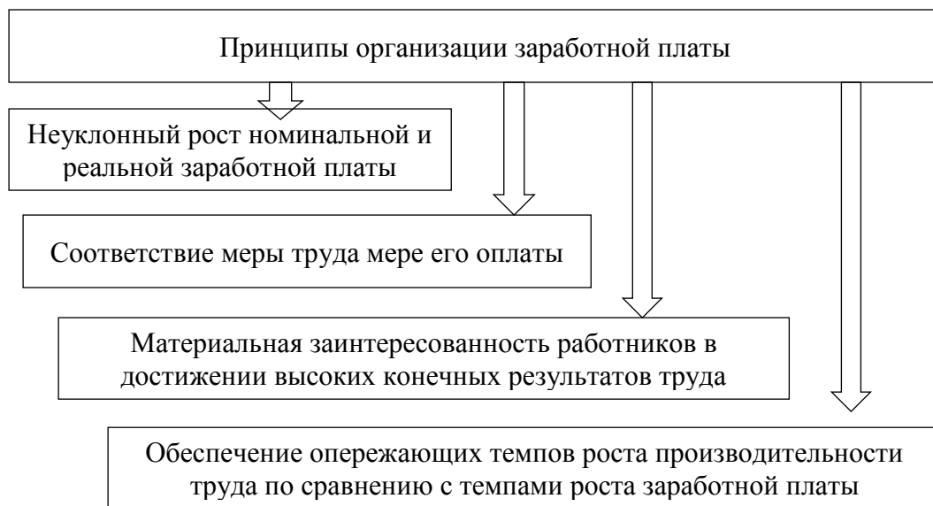
Рис. 1.1. Основные принципы организации заработной платы

Основные принципы организации бухгалтерского учета представлены на рисунке 1.1.