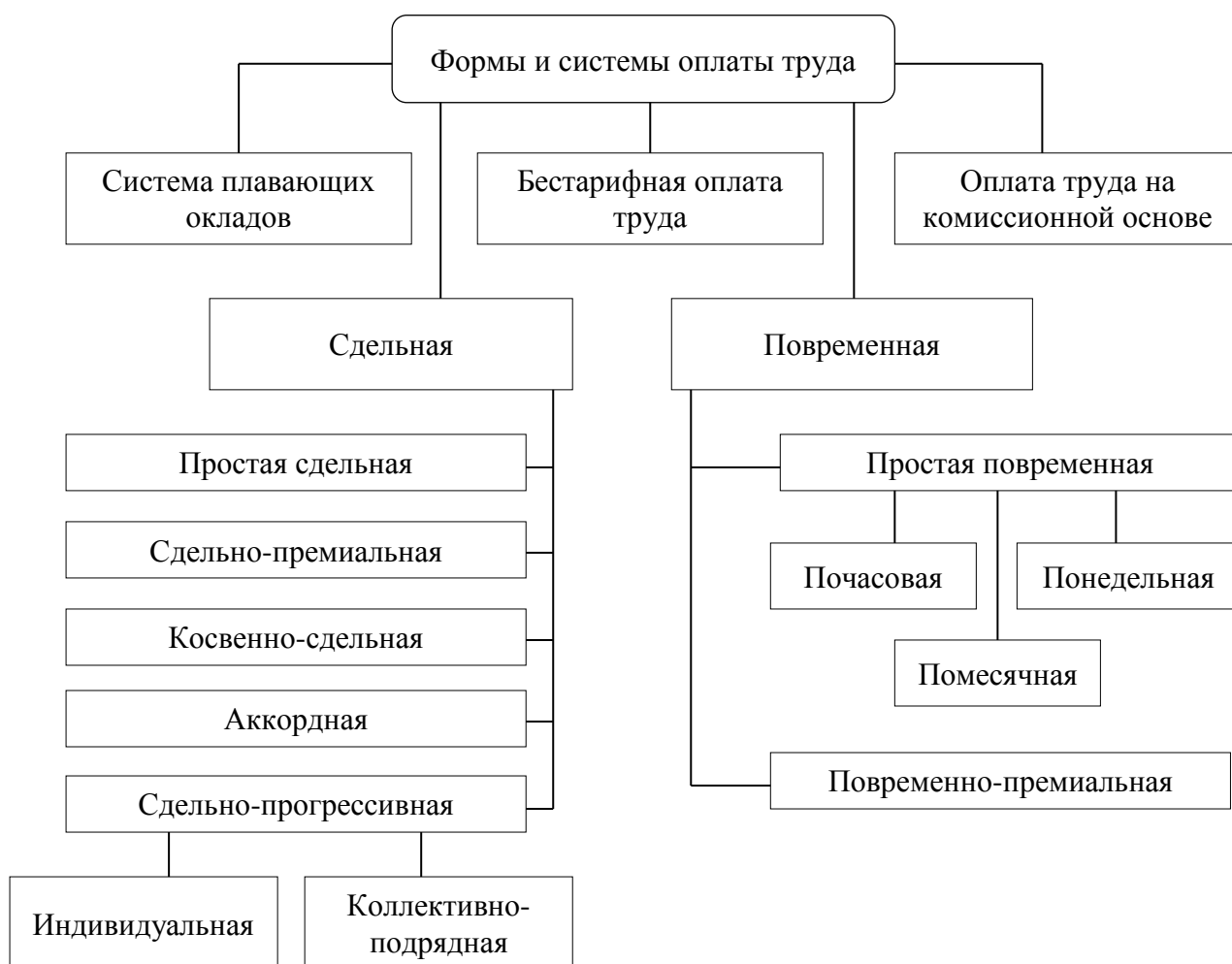
Рис. 1.4. Формы и системы оплаты труда

самостоятельно форму табеля учета рабочего времени и закрепляет ее в своей учетной политике для целей бухгалтерского учета. В качестве примера может использоваться форма № Т-13 и форма № Т-12.