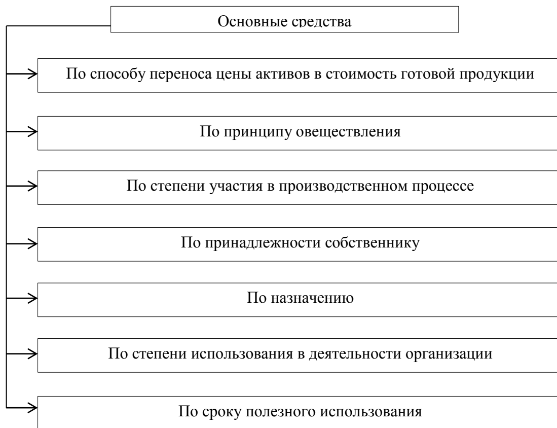
Рис. 1.1 Признаки классификации объектов основных средств

Различные экономисты предлагают множество классификаций объектов основных средств. На рисунке 1.1 представим наиболее существенные признаки, по которым классифицируются основные средства.