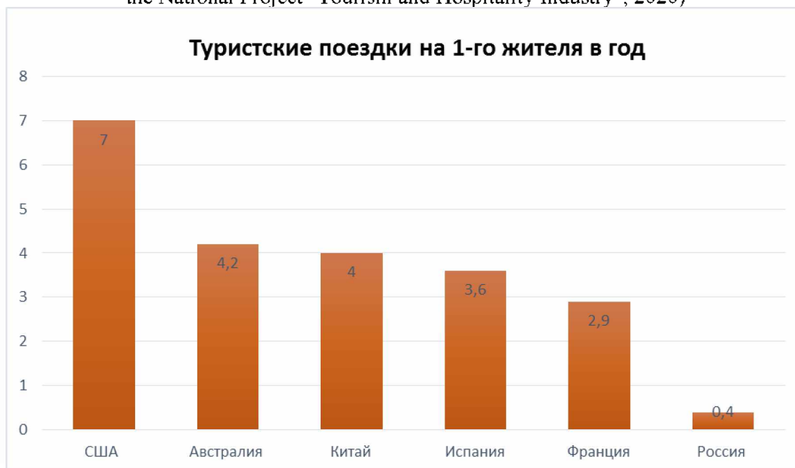
Рис. 2. Количество внутренних туристских поездок на одного жителя страны в год (2019г.) странам (составлено автором на основе данных Национального проекта «Туризм и индустрия гостеприимства», 2020)