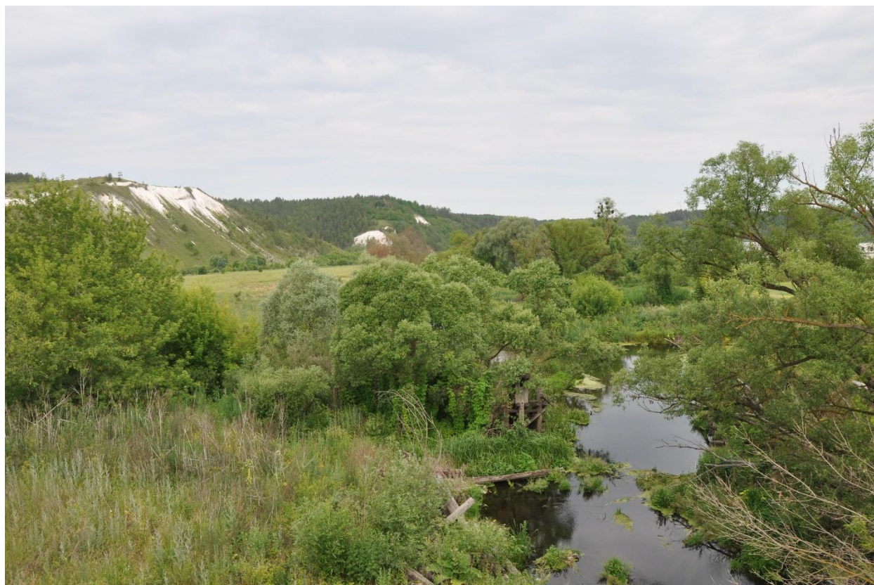
Рис. 3. Вид на «Бекарюковский бор» Fig. 3. View of the «Forest Bekaryukovsky»

Существующие в области зоологические заказники в большей степени призваны охранять обитающих на их территории диких копытных («Бембус»), сурков-байбаков («Мокрый яр»), бобров («Чёртово болото»). Специализированного энтомологического заказника в области нет ни одного. При этом на территории практически всех ООПТ выявлены группировки реликтовых и эндемичных видов беспозвоночных. Благодаря этому, фактически