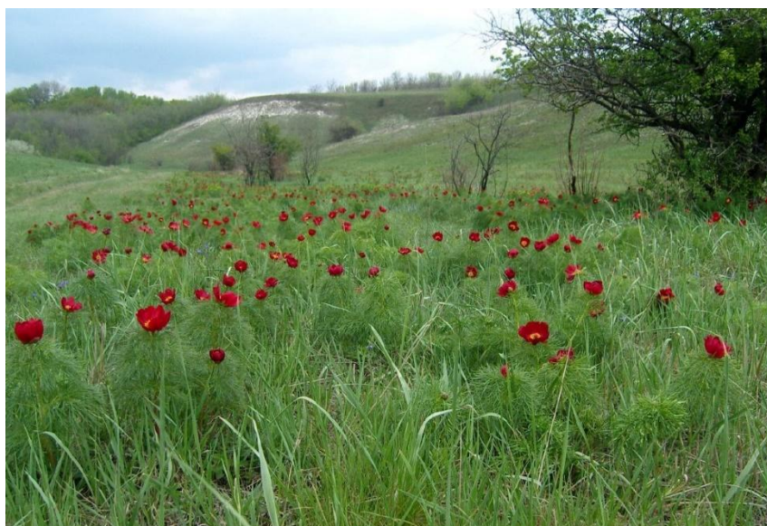
Рис.2. Природный парк «Ровеньский» Fig.2. Natural Park «Rovensky»

В 2004 году природный парк «Хотмыжский» был передан санаторию «Красиво», который должен был обеспечить его функционирование. Практически же финансирование отсутствует, что ведет к нарушению охранного режима (устройству несанкционированных свалок, разработке карьеров и др.), затрудняет и даже сводит на нет научно-исследовательскую работу.