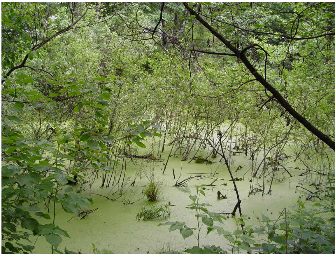
Рис. 4. Болото «Моховое» Fig. 4. Swamp «Mokhovoe»

Памятники природы занимают в регионе наименьшую площадь. Подавляющее количество памятников природы представлено родниками, в том числе карстовыми источниками, а также дубами-долгожителями, возраст которых доходит до 400 лет.