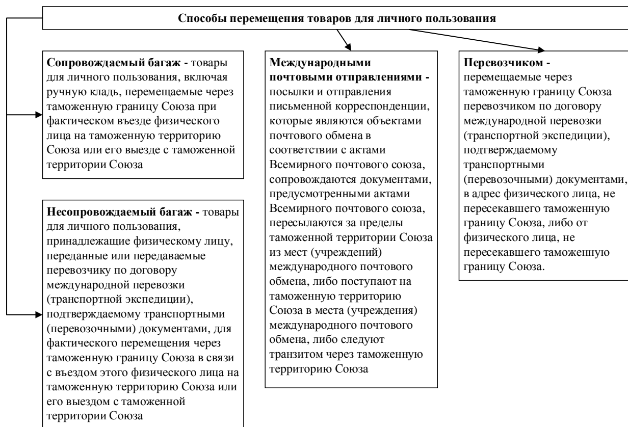
Рис. 1. Способы перемещения товаров для личного пользования через таможенную границу ЕАЭС

В формулировании общих условий совершения таможенных операций с указанными товарами, установленных главой 37 ТК ЕАЭС прослеживается концепция регламентации перемещения товаров физическими лицами для личного пользования, направленная на упрощение и минимизацию формальностей. Способы перемещения товаров для личного пользования через таможенную границу ЕАЭС представлены на рисунке 1.