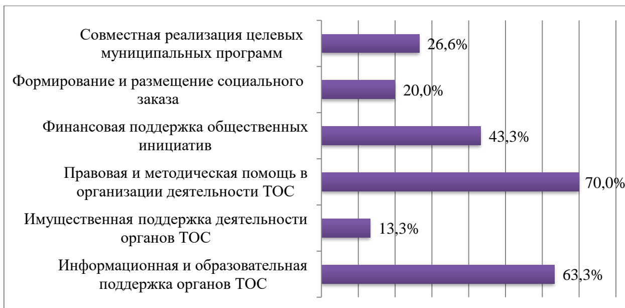
Рис. 1. Распределение ответов на вопрос: «Какие формы взаимодействия органов ТОС и органов местного самоуправления города Белгорода получили наиболее широкое распространение?»

По мнению опрошенных экспертов, наиболее широкое распространение получили следующие формы взаимодействия органов ТОС и органов местного самоуправления г. Белгорода: правовая, методическая, информационная и образовательная поддержка органов ТОС (рисунок 1).