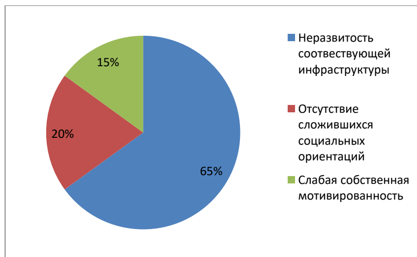
Рис.2. Уровень развитости системы социокультурных мероприятий ( )

Анализируя ответ на вопрос об уровне развитости системы социокультурных мероприятий, большинство родителей отметили неразвитость соответствующей инфраструктуры досуговой деятельности инвалидов. Практически, поделились ответы между отсутствием сложившихся социальных ориентаций и слабой собственной мотивированности (рисунок 2).