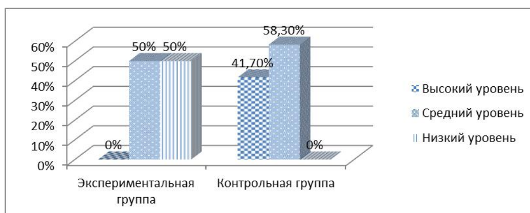
Рис. 2.2 Результаты исследования навыка пересказа у старших дошкольников экспериментальной и контрольной группы

Полученные результаты констатирующего этапа позволили прийти к выводу, что 50% детей старшего дошкольного возраста с общим недоразвитием речи имеют средний уровень сформированности навыка пересказа, остальные 50% детей демонстрируют низкий уровень. Исследование в контрольной группе показало, что у 58,3% старших дошкольников отмечается средний уровень сформированности навыка пересказа, для 41,7% характерным является высокий уровень. Сравнение