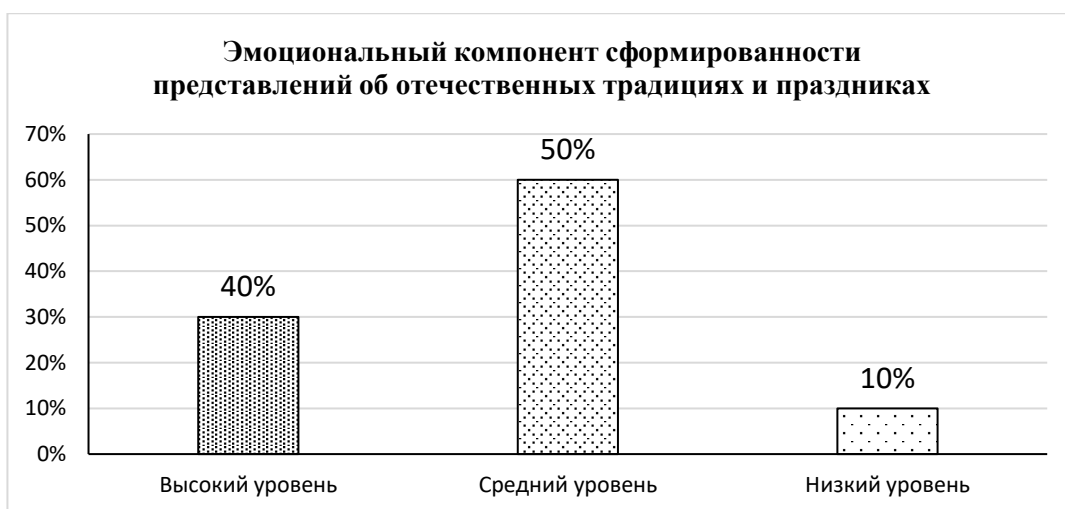
Рис. 2.2. Уровень сформированности эмоционального компонента представлений об отечественных традициях и праздниках у старших дошкольников

Высокий уровень сформированности поведенческого компонента представлений об отечественных традициях и праздниках мы выявили у 6 (30%) детей. Дети отражают эмоционально прочувствованные и осознанные знания в рисовании, лепки, аппликации. Они задают вопросы об отечественных традициях и праздниках, участвуют в проведении отечественных традиций и праздников. Средний уровень сформированности поведенческого компонента представлений об отечественных традициях и праздниках показали 10 (50%) детей. Дети не всегда отражают эмоционально прочувствованные и осознанные отражают знания и представления о праздниках в рисовании, лепки, аппликации. Они иногда задают вопросы об отечественных традициях и праздниках, всегда участвуют в проведении отечественных традиций и праздников. Низкий уровень сформированности поведенческого компонента представлений об отечественных традициях и праздниках проявили 4 (20%) детей. Дети редко отражают эмоционально прочувствованные и осознанные знания в рисовании, лепки, аппликации. Они не задают вопросы об отечественных традициях и праздниках, редко проявляют инициативу участвовать в проведении отечественных традиций и праздников.