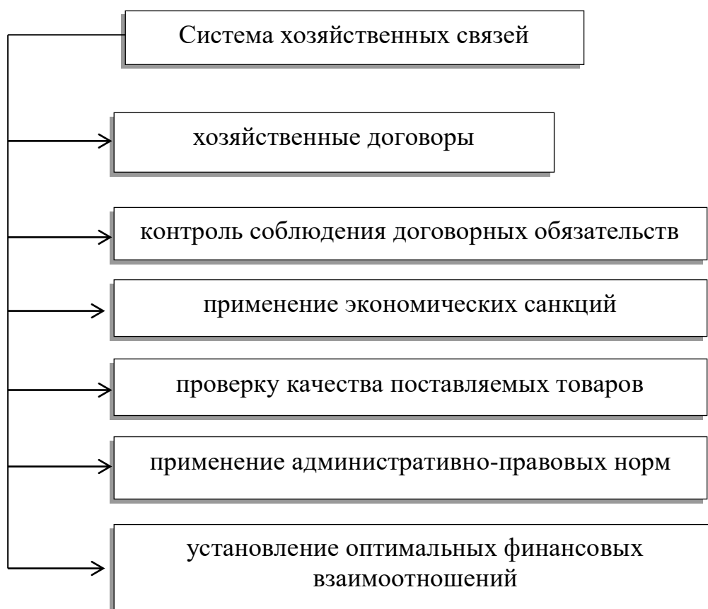
Рис. 2. Система хозяйственных связей.

По мнению автора Кондракова Н. П., к поставщикам и подрядчикам относят организации, поставляющим сырье и другие товарно-материальные ценности, а также оказывающие различные виды услуг (отпуск электроэнергии, пара, воды и др.) и выполняющие различные работы (капитальный и текущий ремонт основных средств и др.) [37, с. 368].