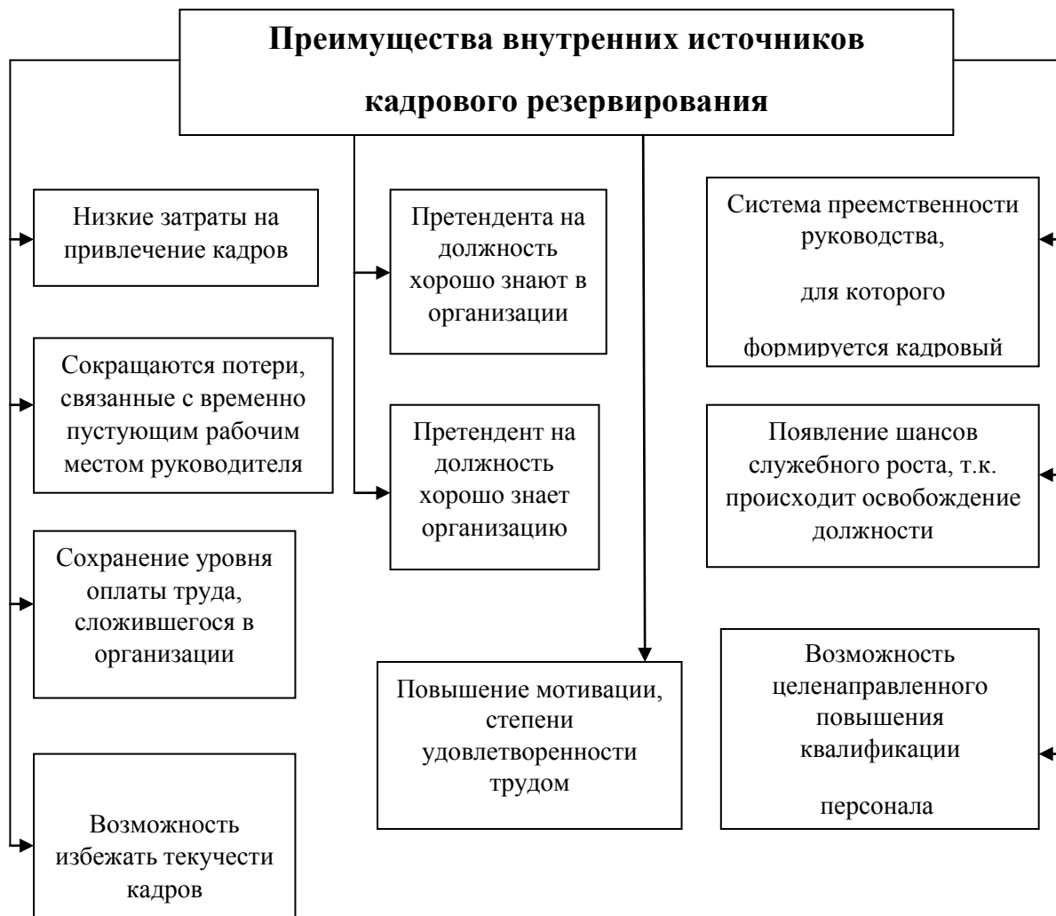
Рисунок 1.1 - Причины использования внутренних источников кадрового резервирования

- выявление и ускоренное развитие управленческого фонда способно обеспечить компании значительное конкурентное преимущество. Подготовленный, правильно расставленный по рабочим местам руководящий персонал принимает более эффективные и обдуманные решения.