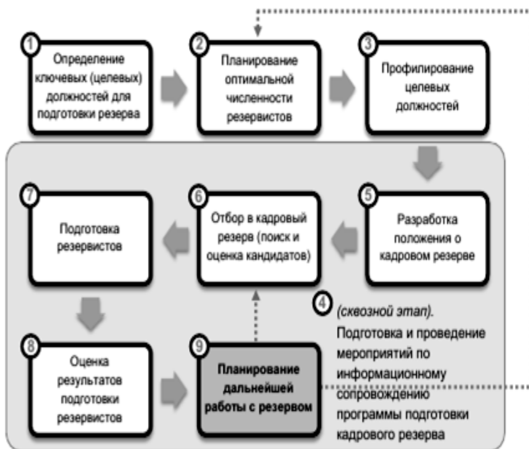
Рисунок 1.2 - Этапы работы с кадровым резервом

Этап 9. Планирование дальнейшей работы с резервом.