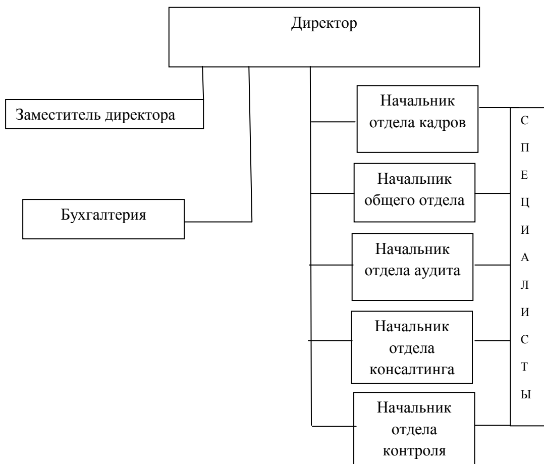
Рис.2.1 Организационная структура

ООО «Агентство профессионального консалтинга»