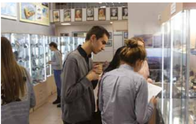
Рис. 3. Изучение студентами систематики минералов и горных пород