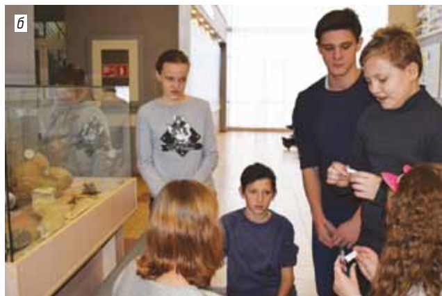
Рис. 6. Школа юного геолога: а – полевые экскурсии и игровые квесты для учащихся; б – аудиторные занятия в музее