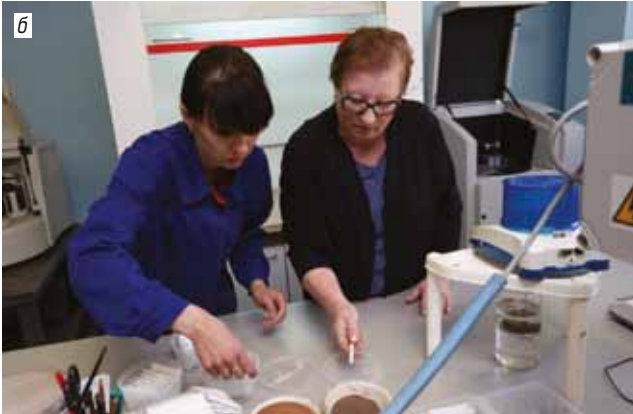
Рис. 4. Научно-исследовательские подразделения Института наук о Земле:

а – Федерально-региональный центр аэрокосмического и наземного мониторинга объектов и природных ресурсов; б – научно-исследовательская лаборатория обогащения минерального сырья