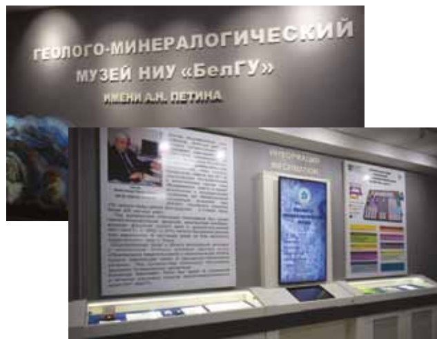
Рис. 2. Входные экспозиции ГММ с интерактивным киоском, витринами и стендами

В связи с тем, что песчаный мел является своеобразной «визитной карточкой» Белогорья, создана специальная экспозиция «Парк мелового периода». На территории Белгородской области сосредоточены колоссальные прогнозны ресурсы мела. На стендах музея представлена информация о генезисе мела в поздне-меловую эпоху.