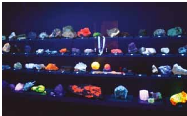
Рис. 5. Экспозиция «Фотолюминесценция (флюоресценция) минералов»: люминесценция минералов при комбинированном воздействии коротко- и длинноволновых УФ-лучей