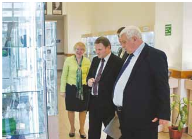
Открытие геолого-минералогического музея НИУ «БелГУ»