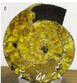
Рис. 4. Экспозиция «Физические свойства минералов»: а – витрины в центре зала № 4, посвященные систематике минералов; б – спил пиритизированной раковины аммонита Speetoniceras versicolor с симбирцитом (кальцитом) в полостях камер (Ульяновская обл.)