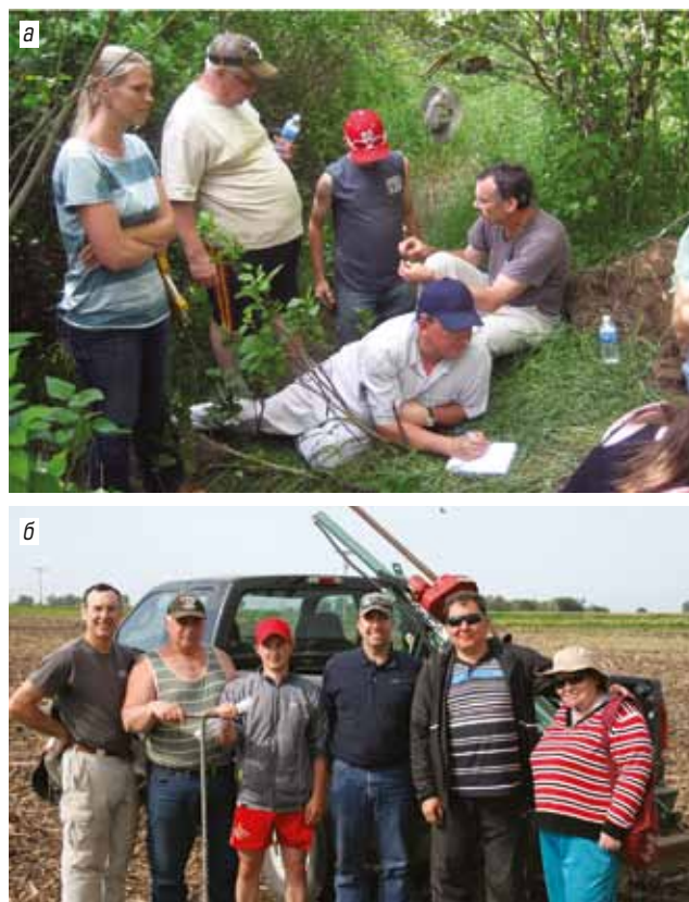
Рис. 3. Российско-американские коллективы при выполнении совместных научных исследований в США:

С 2008 г. активизировалась работа с научными партнерами из дальнего зарубежья. В том же году по Программе Фулбрайта