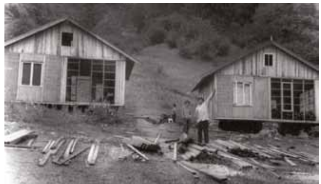
Строительство учебно-научной базы Чечено-Ингушского университета