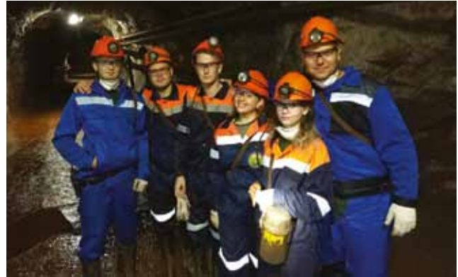
Рис. 5. Студенты специальности «Горное дело» на производственной практике в шахте Яковлевского ГОКа

На горно-буровой практике студенты в полевых условиях осваивают методы бурения скважин, изучают современную буровую